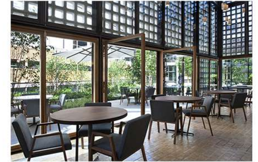
NEGOCIOS DE ENCUENTRO EN PLANTAS BAJAS

NUESTRA PROPUESTA DE UTOPIA CONSISTE EN LA REALIZACION DE UN GRAN BLOQUE RESIDENCIAL, EL CUAL CONSTITUYE UNA GRAN MANZANA "CERRADA" DE NUEVE PLANTAS Y CON UNA TERRAZA MIRADOR EN LA PARTE SUPERIOR. DICHA MANZANA, CUENTA CON ACCESOS EN LAS ESQUINAS A TRAVES DE PEQUEÑAS PLAZAS QUE CONECTAN EL RESTO DE LA CIUDAD CON UN INTERIOR NATURAL.