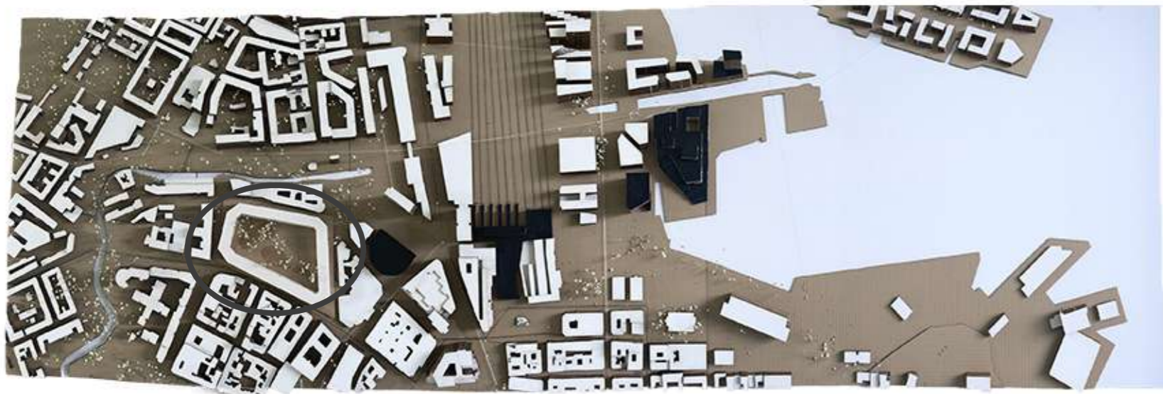
UBICACIÓN DE LA UTOPIA

NUESTRA PROPUESTA DE UTOPIA CONSISTE EN LA REALIZACION DE UN GRAN BLOQUE RESIDENCIAL, EL CUAL CONSTITUYE UNA GRAN MANZANA "CERRADA" DE NUEVE PLANTAS Y CON UNA TERRAZA MIRADOR EN LA PARTE SUPERIOR. DICHA MANZANA, CUENTA CON ACCESOS EN LAS ESQUINAS A TRAVES DE PEQUEÑAS PLAZAS QUE CONECTAN EL RESTO DE LA CIUDAD CON UN INTERIOR NATURAL.