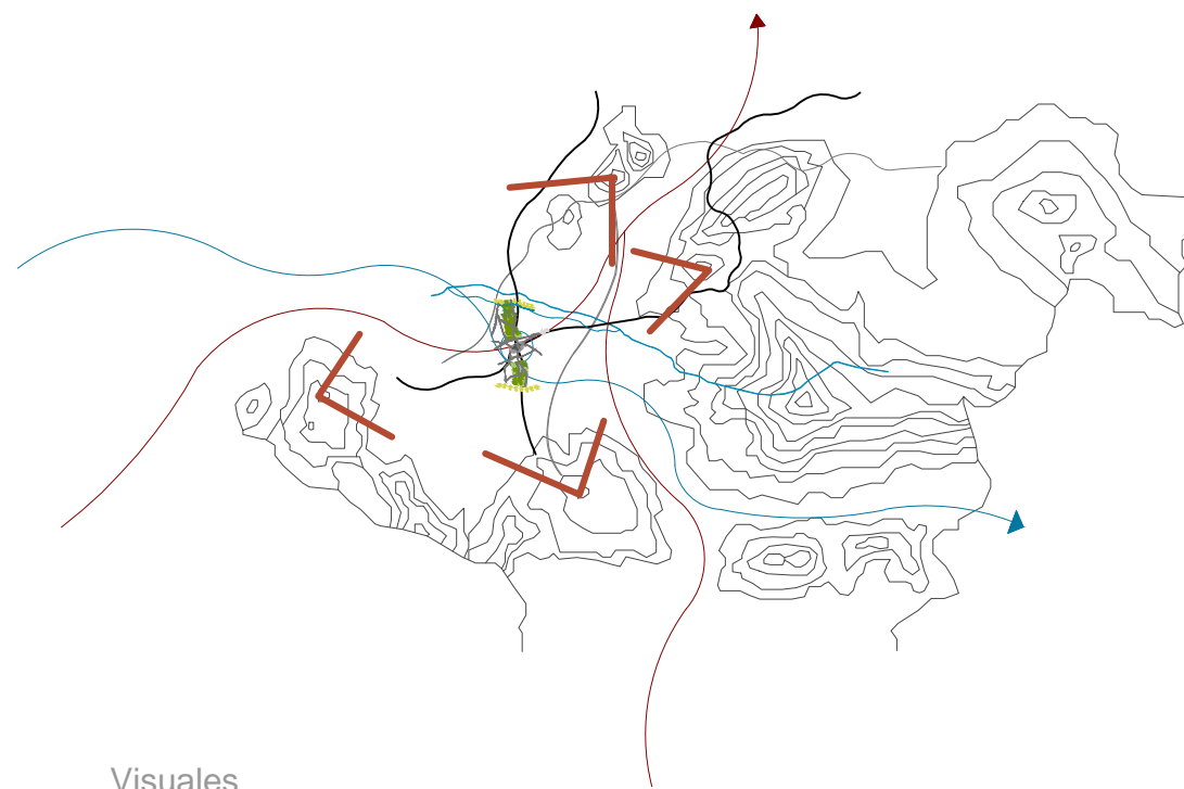
Sistema de vegetación y caminos

En relación a la relación que establece Santa Fe con el territorio, se realiza, mediante un sistema de cultivos planificado, que rodea a la ciudad de Santa Fe. La vegetación que rodea y se manifiesta como paisaje, se basa, en pequeños huertos, o cultivos industriales, como cereal, viñas y olivos. No existen apenas visuales desde el interior del casco antiguo, solo se consiguen saliendo a las afueras de la ciudad, para contemplar, que Santa Fe está totalmente rodeado de vega. Un camino principal atraviesa Santa Fe, y una autovía pasa tangente a este. Una diversidad de caminos salen de la ciudad, para adentrarse en los cultivos que rodean la ciudad.