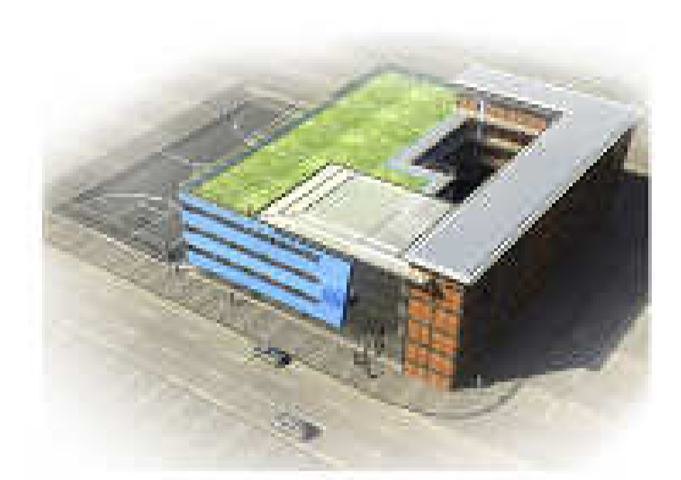
CENTRO DE JOVENES MULTI-FUNCIONAL EN SOMALIA