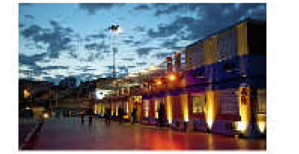
FRICHE DE LA BELLE-DE-MAI TRASFORMACION DE UNA ANTIGUA FABRICA DE TABACO EN UN CENTRO POLICULTURAL EN UN BARRIO SENSIBLE DE MARSELLA, SU DIFUSION ES AHORA MUY AMPLIA.