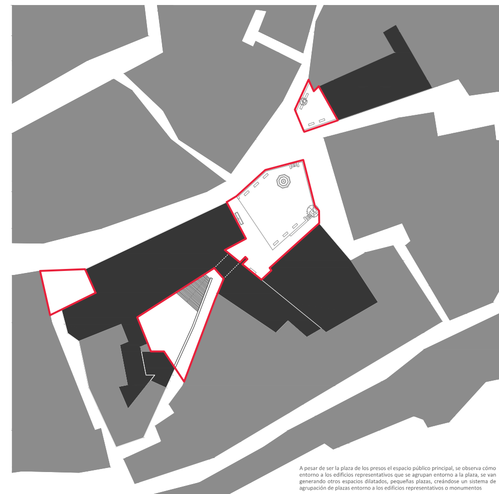
A pesar de ser la plaza de los presos el espacio público principal, se observa cómo entorno a los edificios representativos que se agrupan entorno a la plaza, se van generando otros espacios dilatados, pequeñas plazas, creándose un sistema de agrupación de plazas entorno a los edificios representativos o monumentos