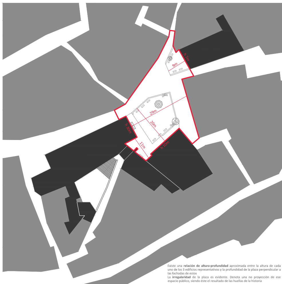
Existe una relación de altura-profundidad aproximada entre la altura de cada uno de los 3 edificios representativos y la profundidad de la plaza perpendicular a las fachadas de estos. La irregularidad de la plaza es evidente. Denota una no proyección de ese espacio público, siendo éste el resultado de las huellas de la historia