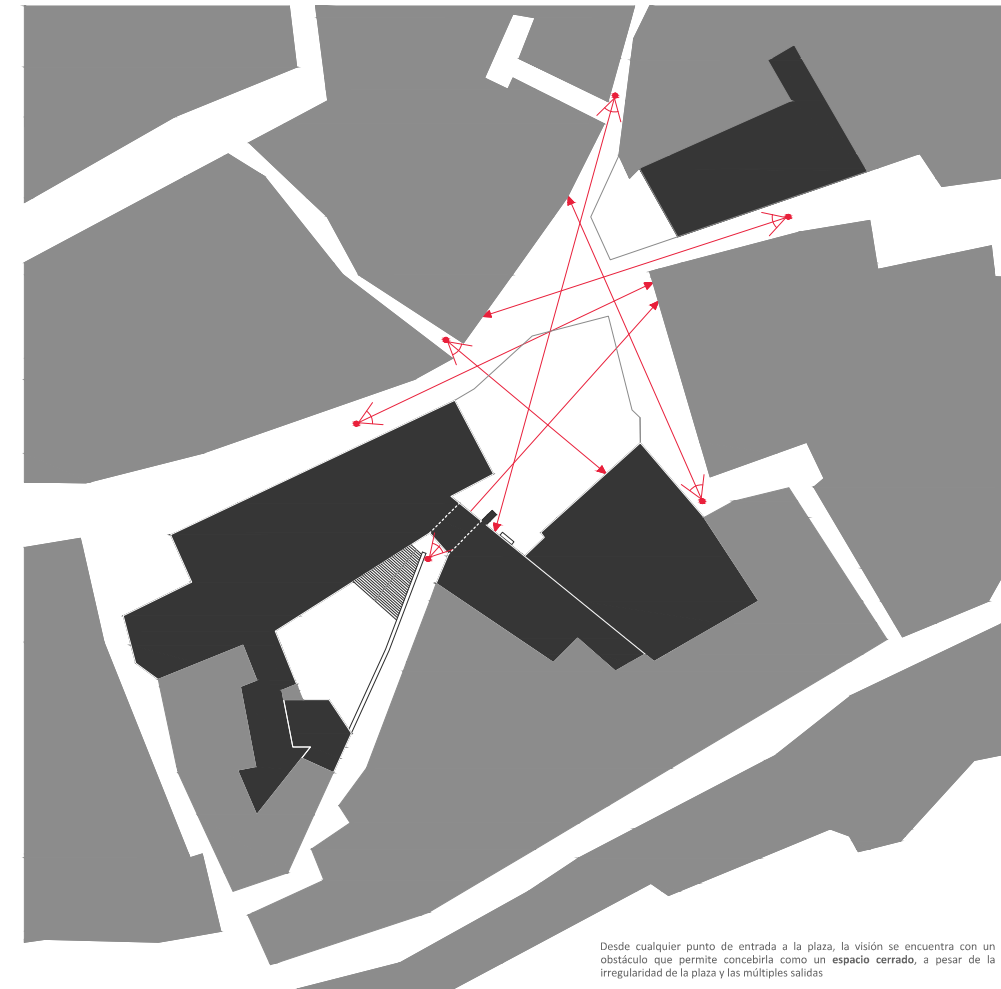
Desde cualquier punto de entrada a la plaza, la visión se encuentra con un obstáculo que permite concebirla como un espacio cerrado, a pesar de la irregularidad de la plaza y las múltiples salidas