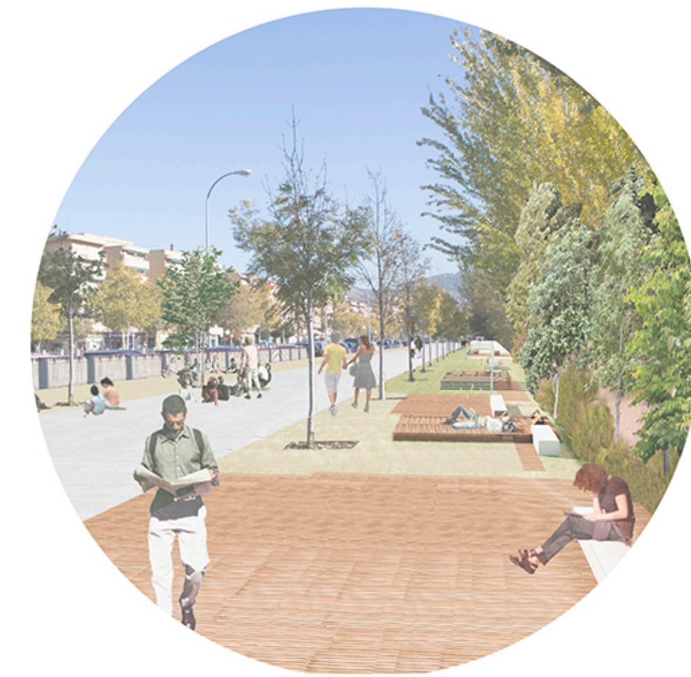
TRANSFORMACIÓN DE LA RED VIARIA Y PEATONAL