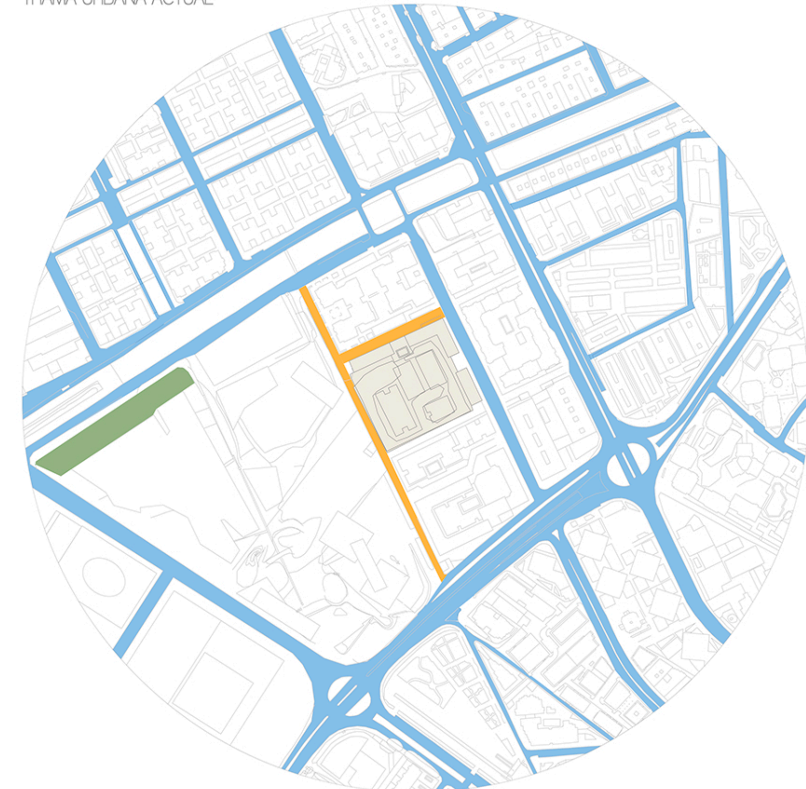
TRAMA URBANA ACTUAL