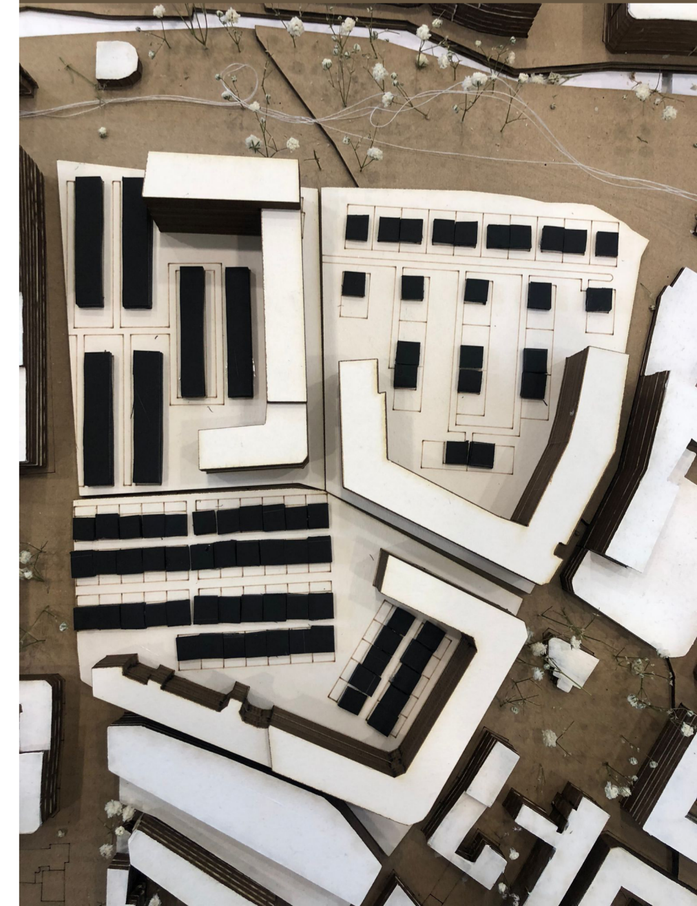
Parcelas con la intervención