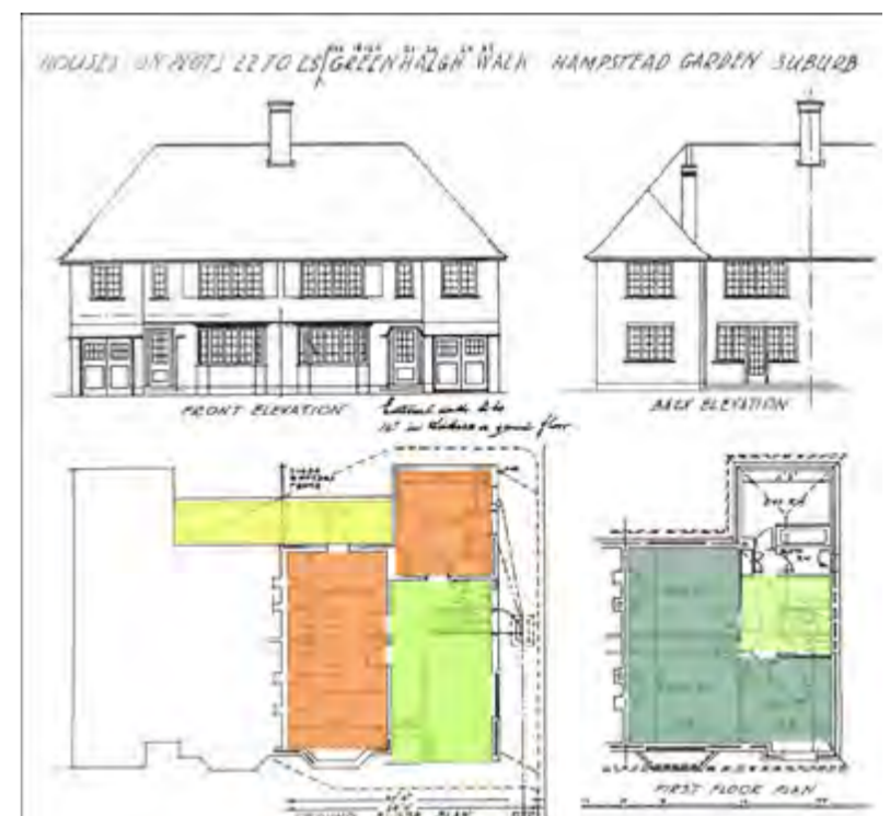
Planta baja y primera planta