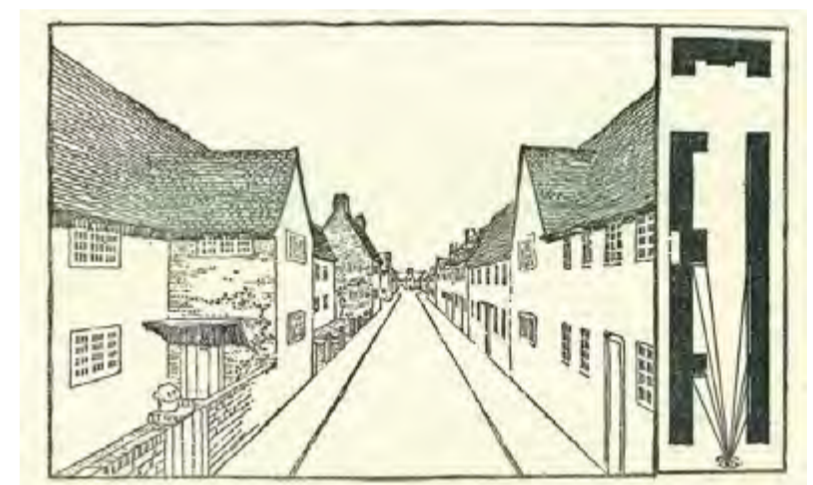
Perspectiva de los frentes