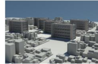
CENTRO URBANO PRESIDENTE ALEMÁN