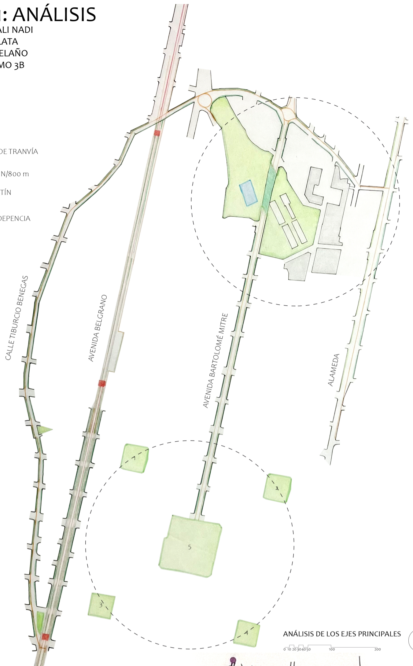
ANÁLISIS DE LOS EJES PRINCIPALES