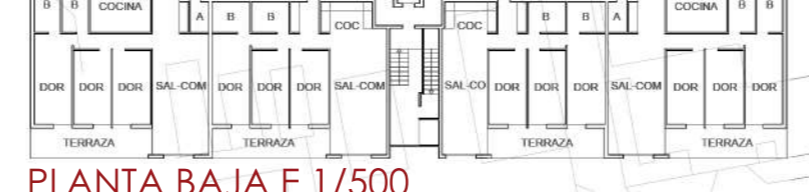
PLANTA BAJA E 1/500