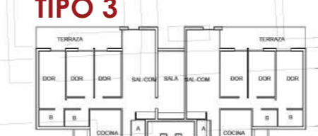
PLANTA TIPO E 1/500