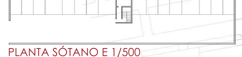
PLANTA SÓTANO E 1/500