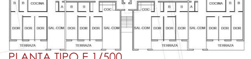
PLANTA TIPO E 1/500