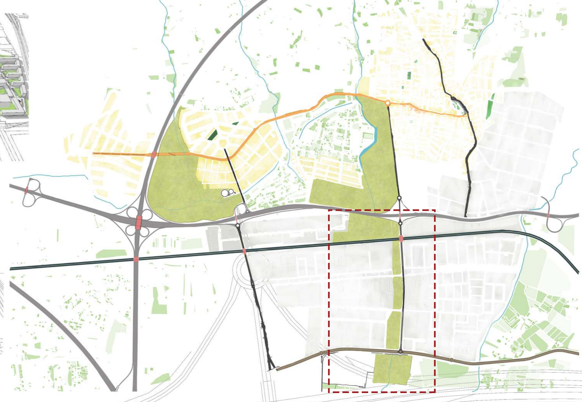
RELACIÓN CON EL MASTERPLAN