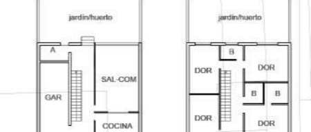
PLANTA TIPO E 1/500