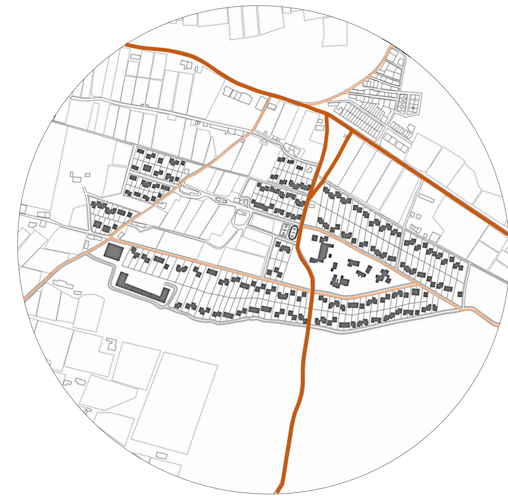
Vías principales y secundarias