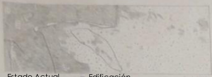
Estado Actual Edificación Zonas Verdes E. 1:20000