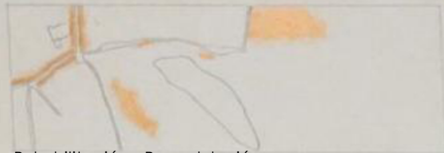
Rehabilitación y Remodelación E. 1:20000