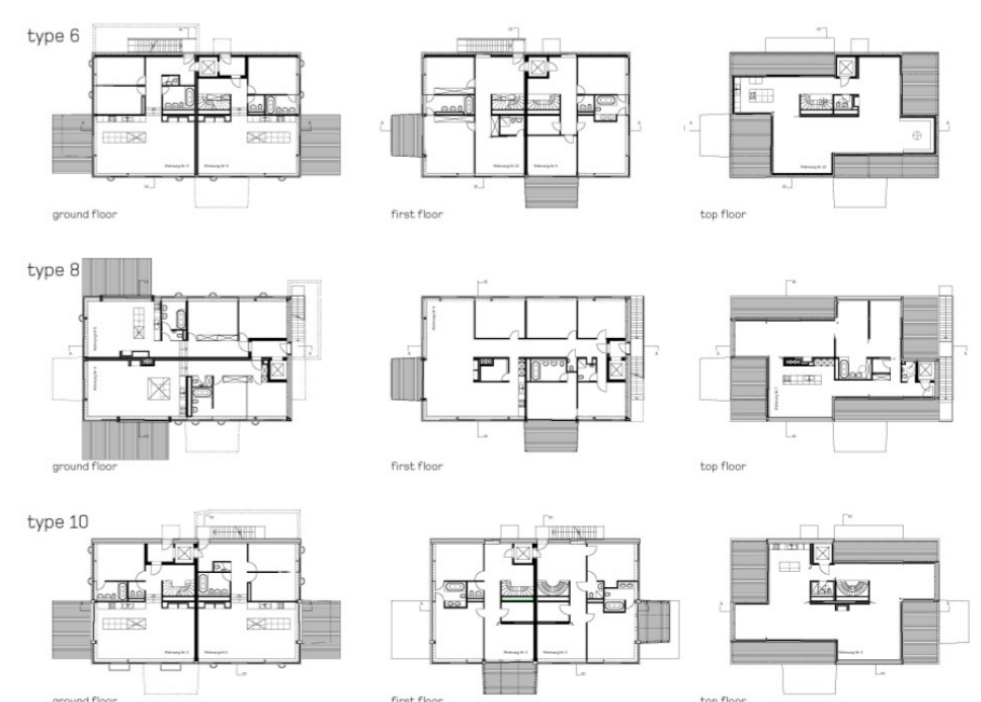
Wehrenbachhalde, Zurich por Burkhalter & Sumi