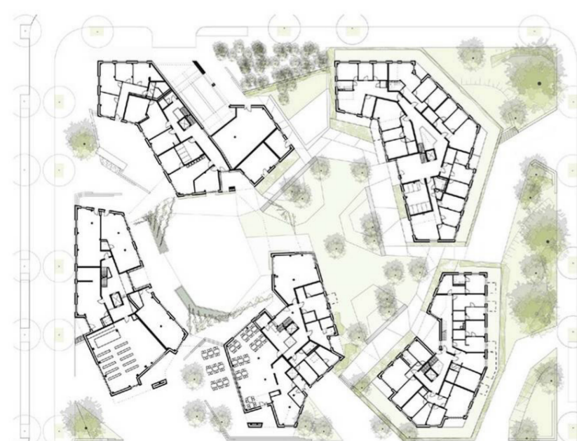
Munich's WagnisART cooperative in North America