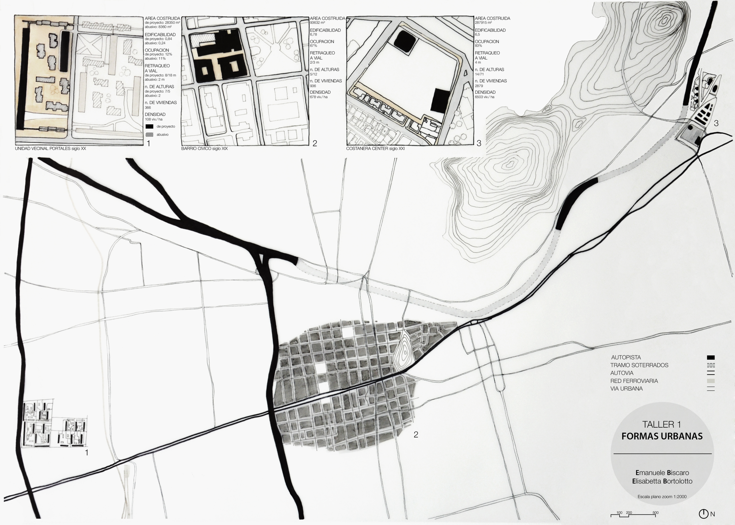
COSTANERA CENTER siglo XXI