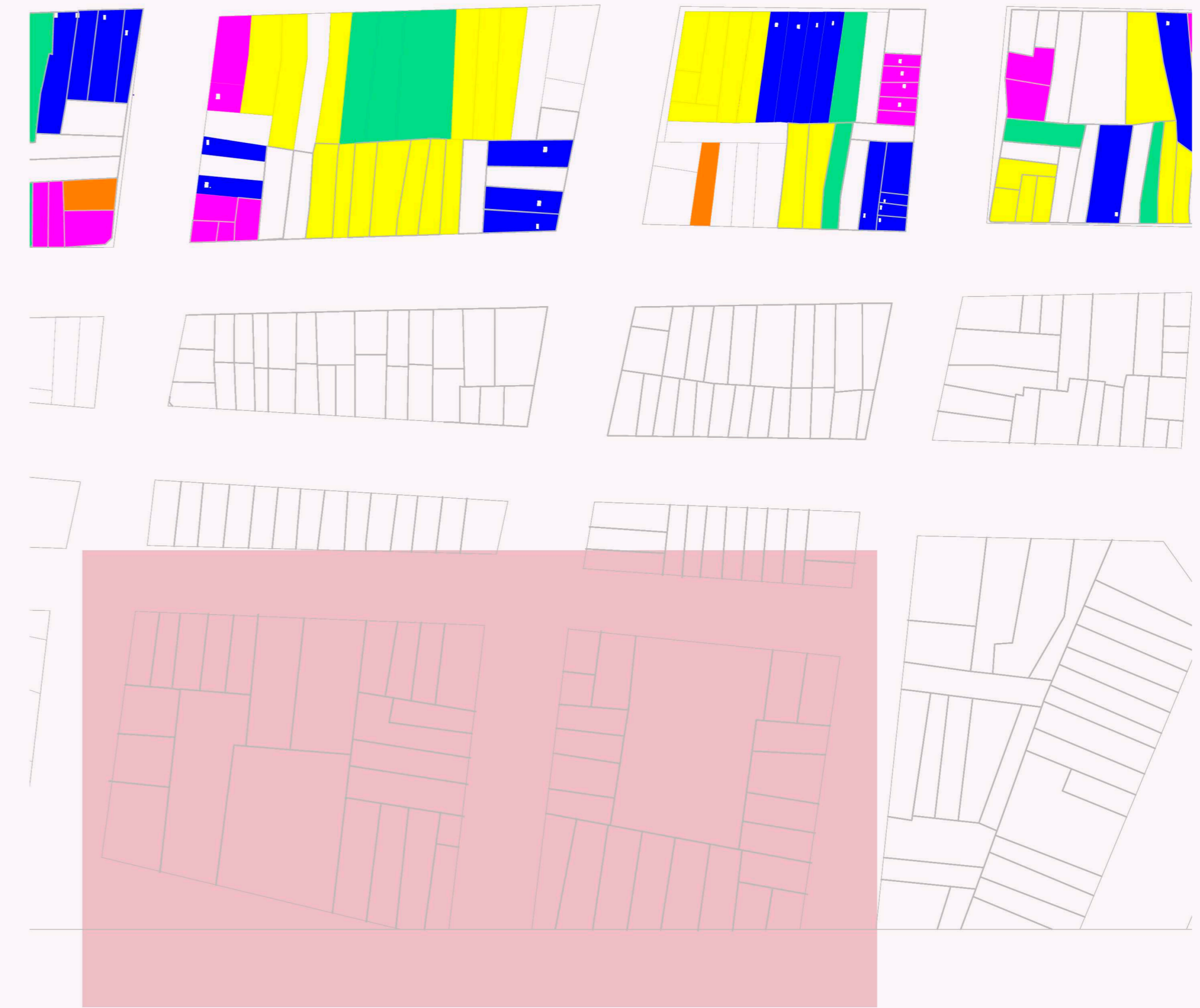
ZONA DE INTERVENCIÓN EN PLANO 1/500

SE HA ELEGIDO COMO ZONA DE INTERVENCIÓN UNA DE LAS PARTES DE LA CIUDAD MÁS DETERIORADAS, Y LA CUAL A NUESTRO PARECER PRECISA DE UNA INTERVENCIÓN MAYOR, PUESTO QUE ES NECESARIA UN REAVIVAMIENTO, Y UNA GENERACIÓN DE MOVIMIENTO EN ESA ZONA.