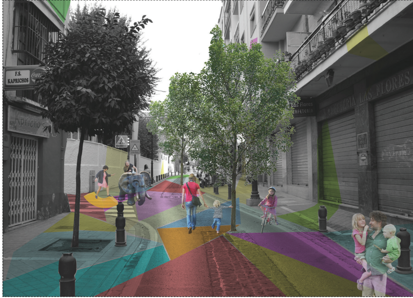
SECUENCIA 5 - Cambiar la percepcion de un lugar con acciones ligeras.