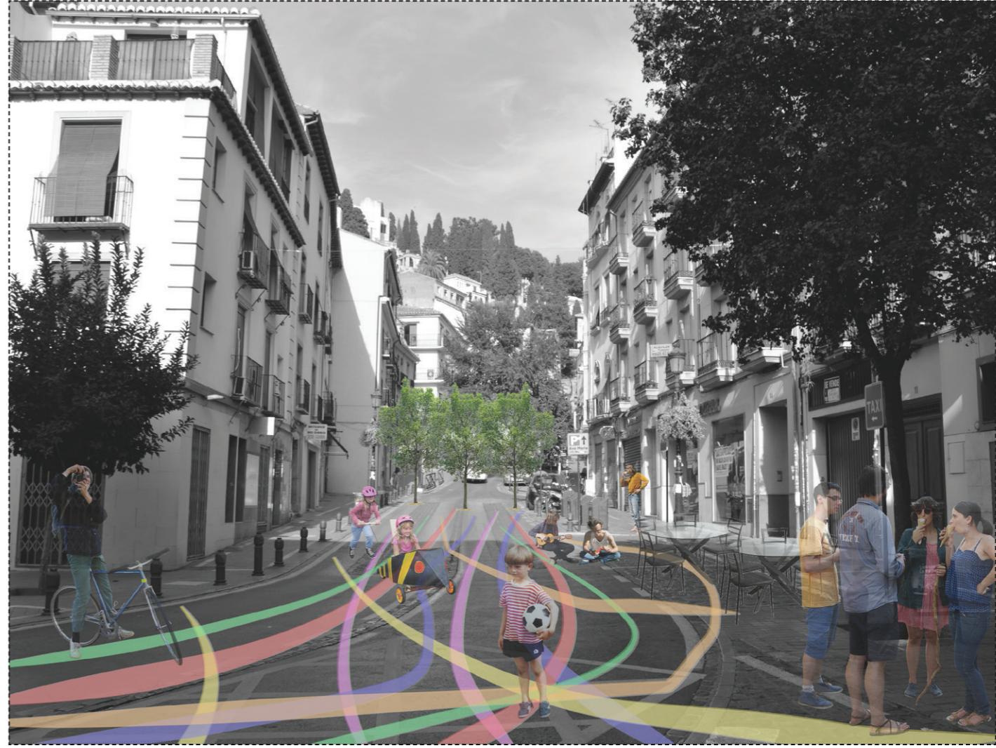
SECUENCIA 1 - Lineas de colores. Economia del proyecto.