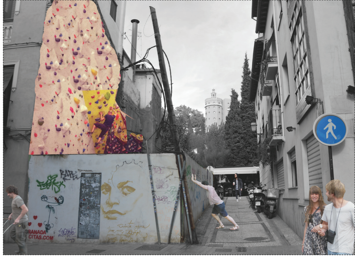
SECUENCIA 3 - Muro de escalada : el juego en la ciudad.