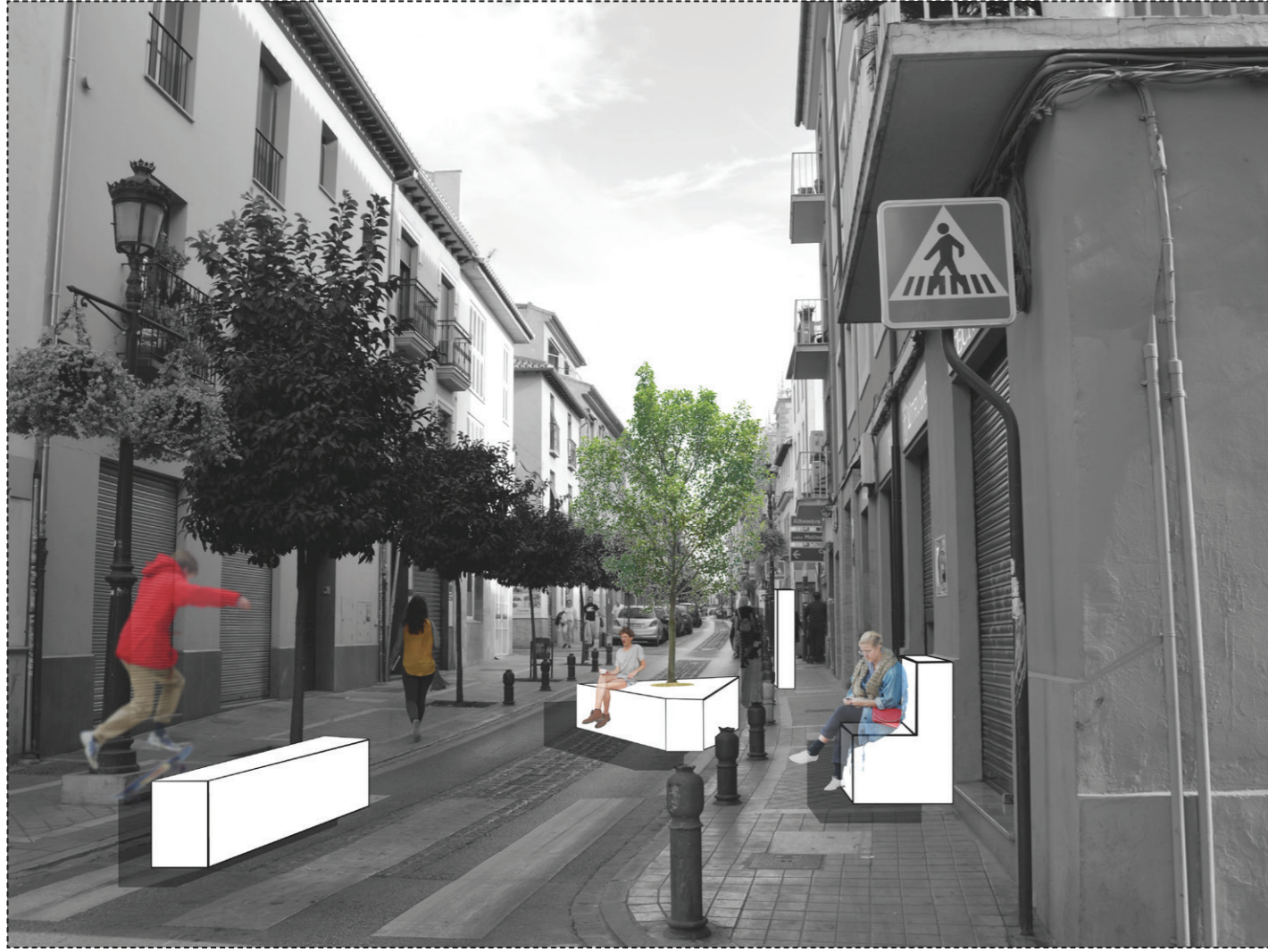
SECUENCIA 4 - Mobiliario urbano ludico.