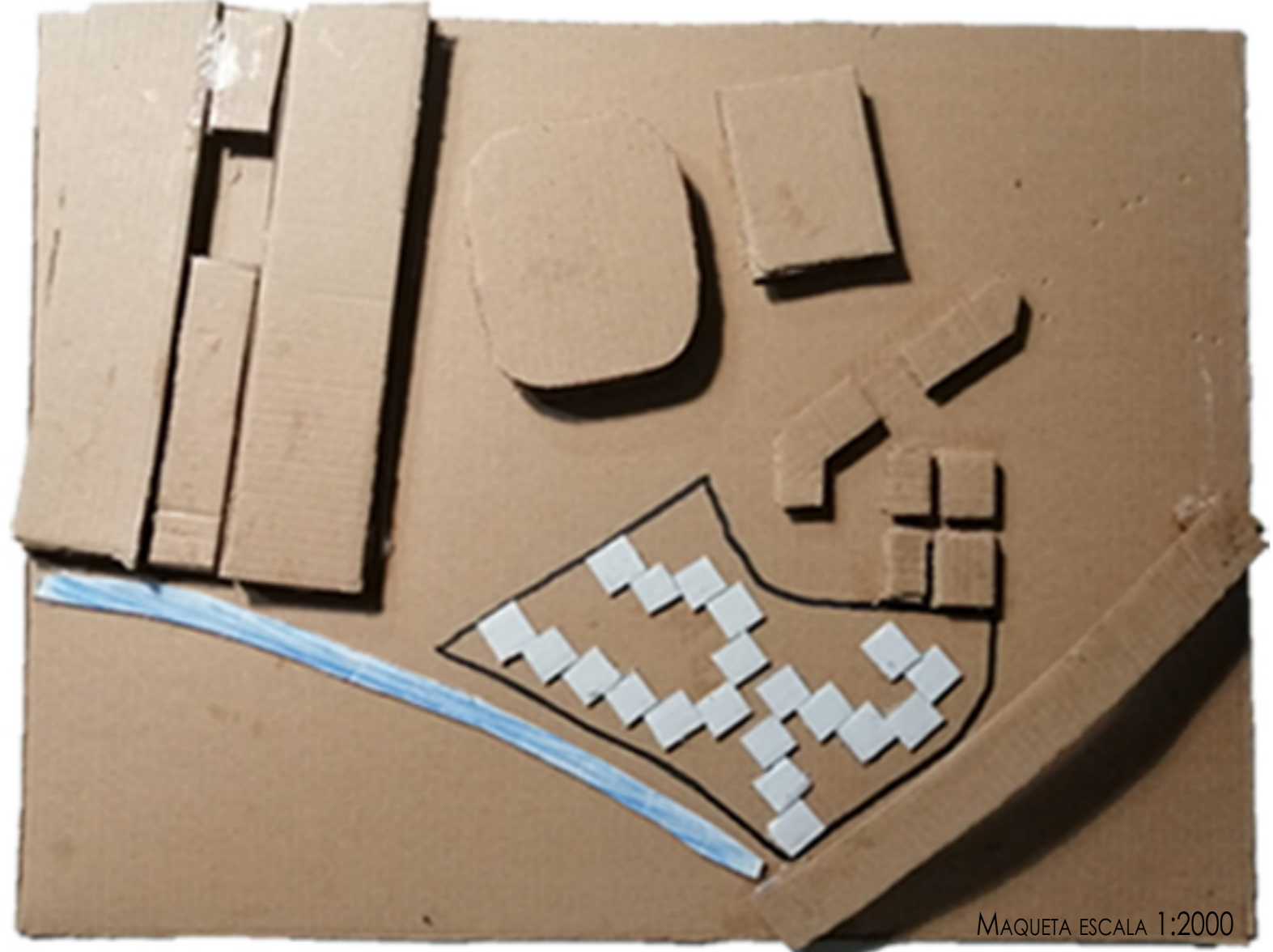
MAQUETA ESCALA 1:2000

AQUI PODEMOS APRECIAR LA PROPUESTA DE DISEÑO, RELACIONADA CON LAS CONSTRUCCIONES EXISTENTES, EVADIENDO COMO HE DICHO ANTES, CUALQUIER TIPO DE RELACION CON LA AUTOPISTA, TENIENDO CONEXION DIRECTA CON EL RIO MONACHIL. LA INTENCION ES ESTA, CREAR VIVIENDAS UNIFAMILIARES, CERCA DEL CENTRO, CON LOS SERVICIOS DE LA CIUDAD CERCA, CONEXION DIRECTA CON LA NATURALEZA Y ESPACIOS ABIERTOS, Y TAMBIEN COMO REFERENCIA A ORAS FORMAS DE CONSTRUCCION MAS ALLA DE LA AUTOPISTA, QUE RECUERDA A UNA MURALLA, QUE DEFINE EL FINAL DE LA CIUDAD DE GRANADA.