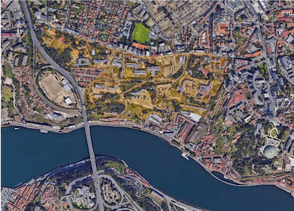
Localización del área de intervención.