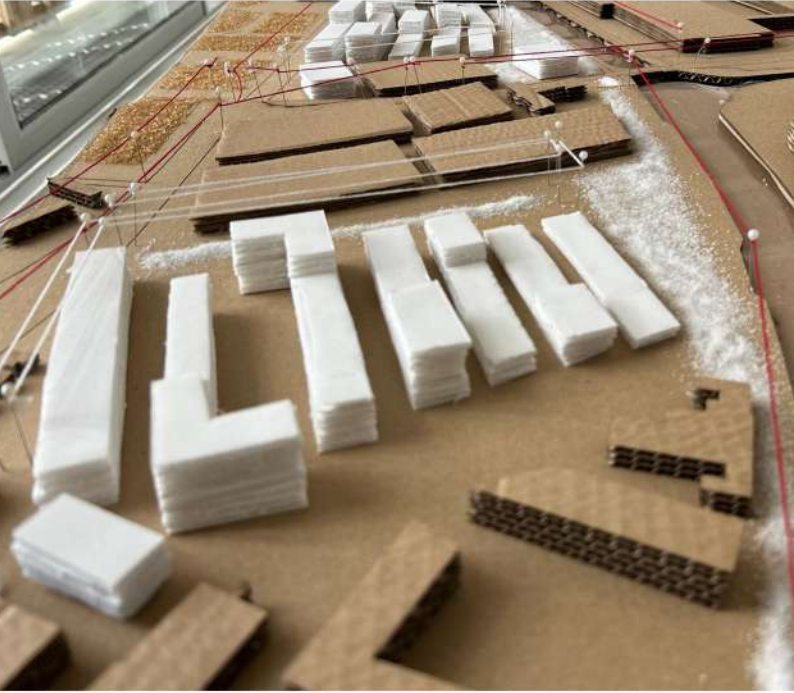
Maqueta a escala 1/1000

La intervención introduce una mezcla de usos a través de una densificación selectiva sobre antiguos aparcamientos, combinando vivienda con posibles usos terciarios. La relación con el agua se refuerza mediante una franja verde continua y plataformas bajas sobre el canal, transformándolo en un espacio activo. La nueva edificación, mayoritariamente lineal, genera avenidas principales orientadas hacia hitos urbanos como la feria de muestras, reforzando la conexión con la ciudad existente.