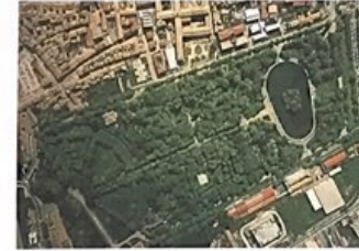
Ejemplo Parco Ducale - Parma (Italy)