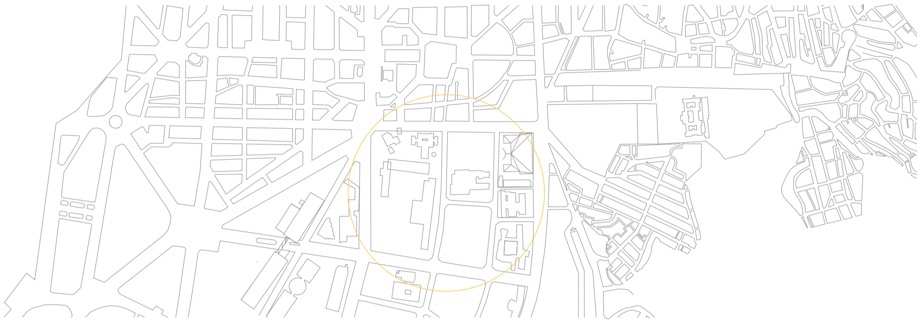
ESTADO ACTUAL ZONA

En resumen, creo un lugar de unión de toda la ciudad, creando un espacio en el que se invita a pasar el rato, a cotemplar el paisaje y la ciudad.