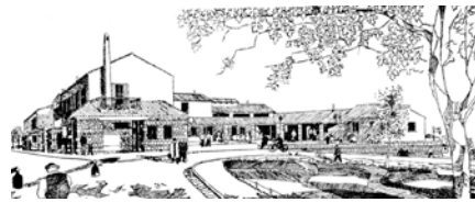
Vista espacio común