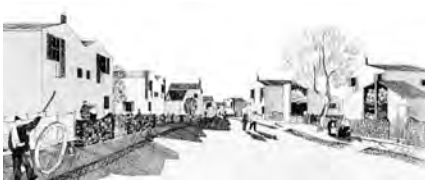
Vista general de la calle