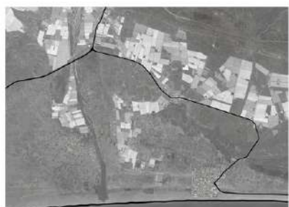
BORDE DE LA VENTANA