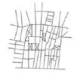
CABO DE GATA

Perpendicularidad y Direccionalidad al Paseo marítimo