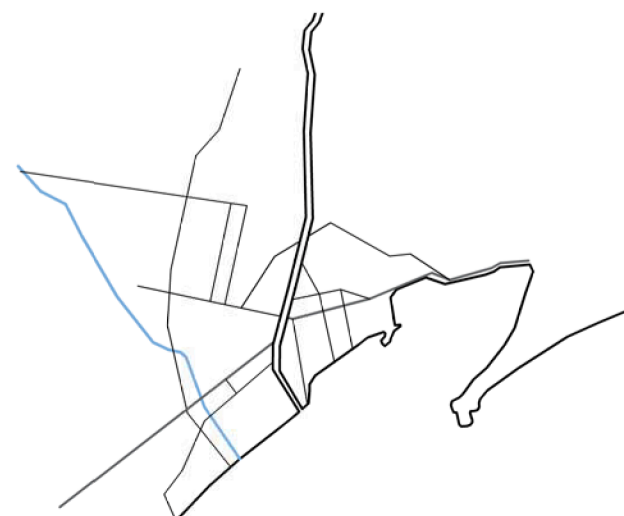
PLAN DE 1861