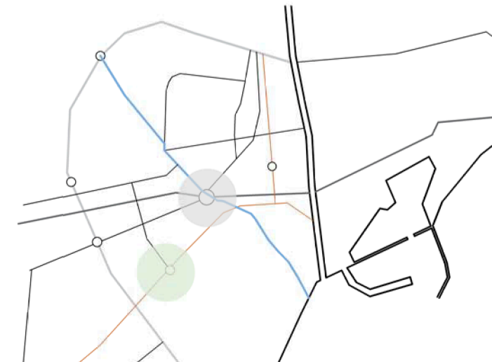
PLAN DE 1950