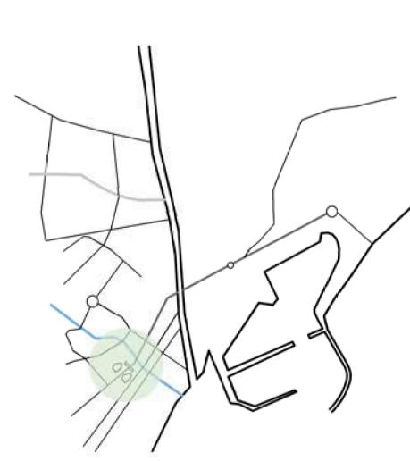
PLAN DE 1929