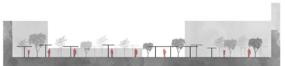
SECCION LONGITUDINAL ESCALA 1:750

PROPONEMOS RECUPERAR EN LA ZONA DE INTERVENCION UN ESPACIO MULTIFUNCIONAL, DE DIVERSIDAD DE USOS, EN LOS QUE EL VIADANTE, EN LA ACTUALIDAD INFRavalORADO POR EL VEHICULO RODADO, SEA EL PROTAGONISTA.