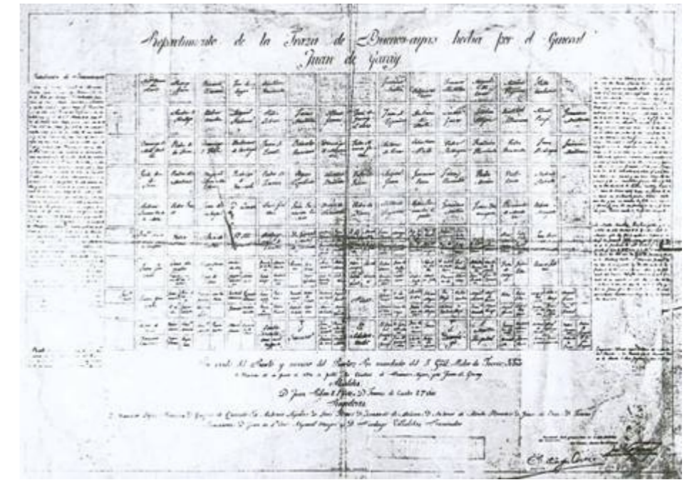
PLANO FUNDACIONAL 1536