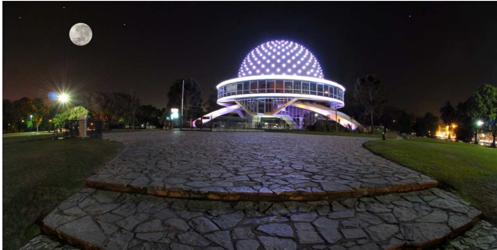
Planteario Galileo Galilei, Palermo