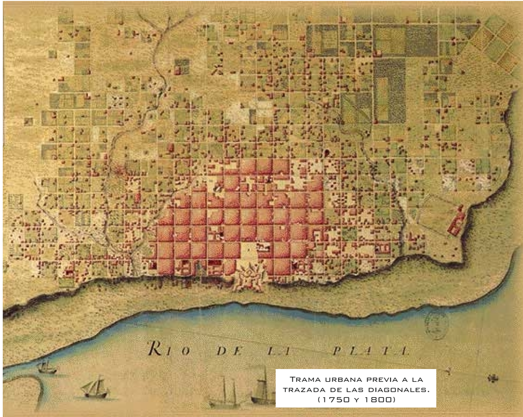
TRAMA URBANA PREVIA A LA TRAZADA DE LAS DIAGONALES. (1750 Y 1800)