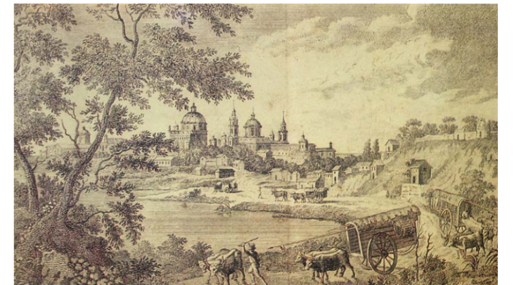
GRABADO CIUDAD DE BUENOS AIRES. SIGLO XVIII