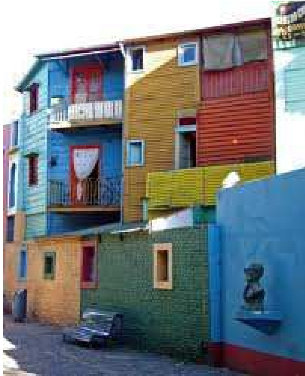
BARRIO DE LA BOCA