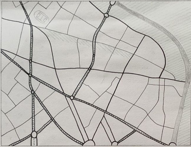
plano calles principales (bus) y secundarias (coches)