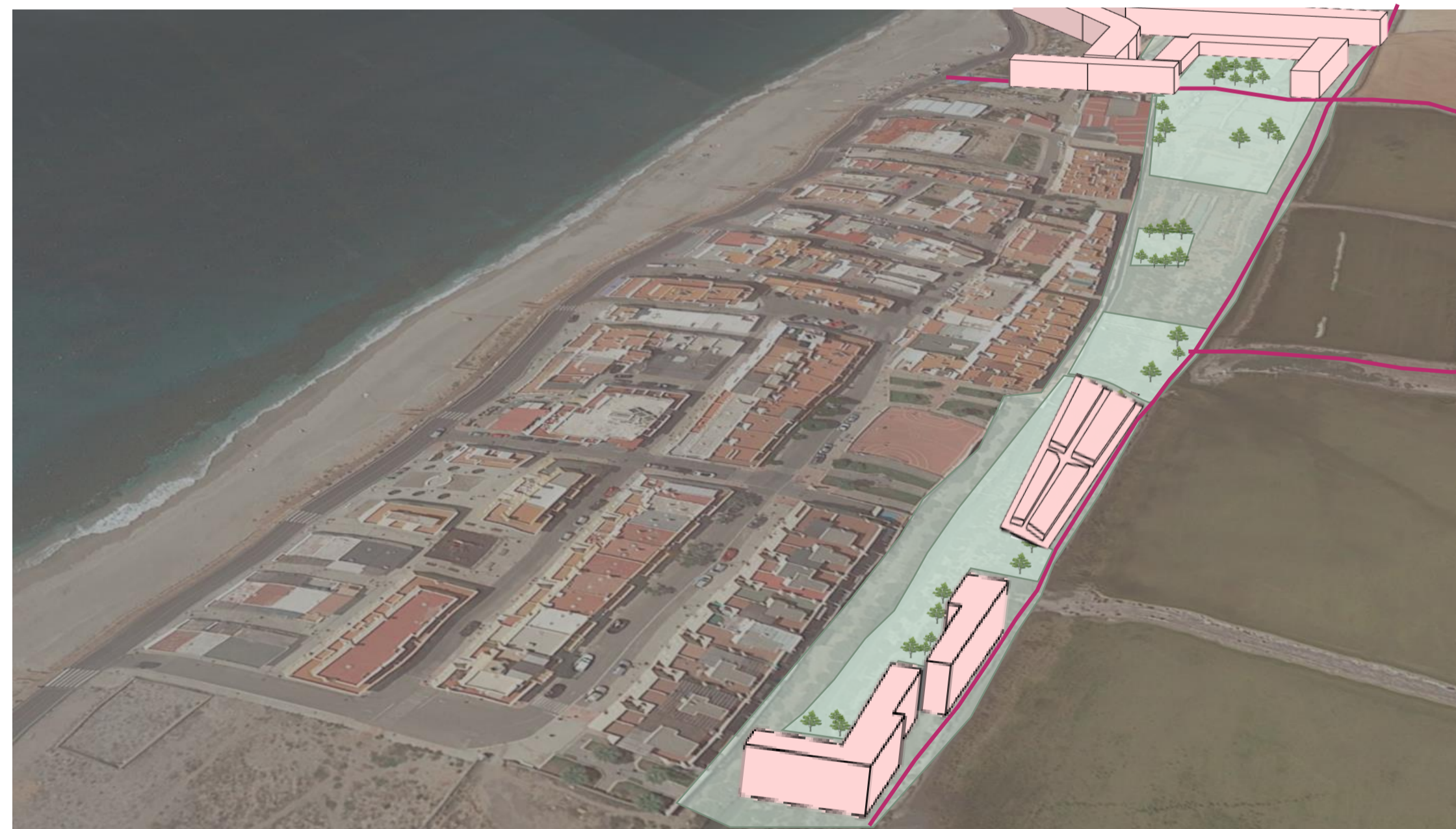
AMPLIACIÓN EN ALMADRABA