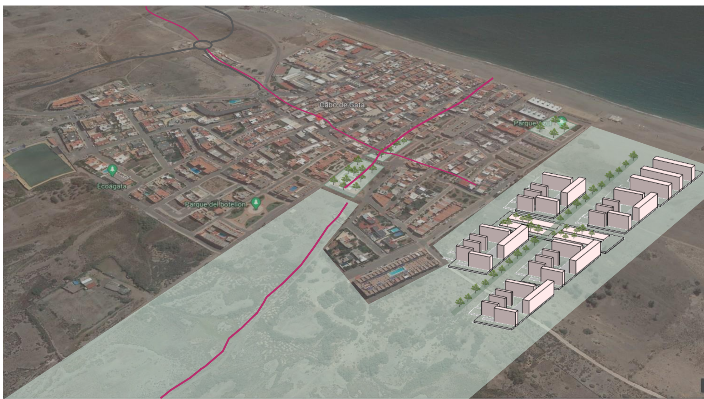
AMPLIACIÓN EN CABO DE GATA