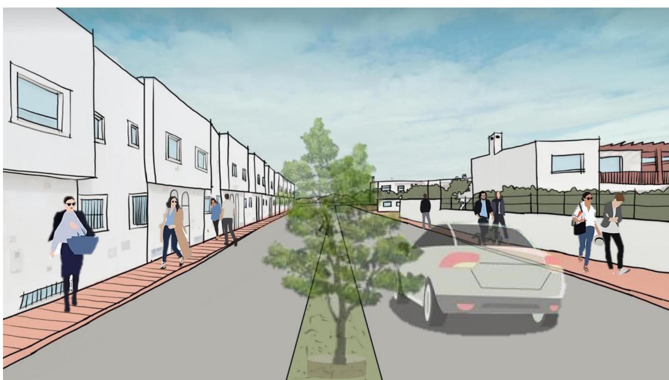
RECREACIÓN EN CABO DE GATA