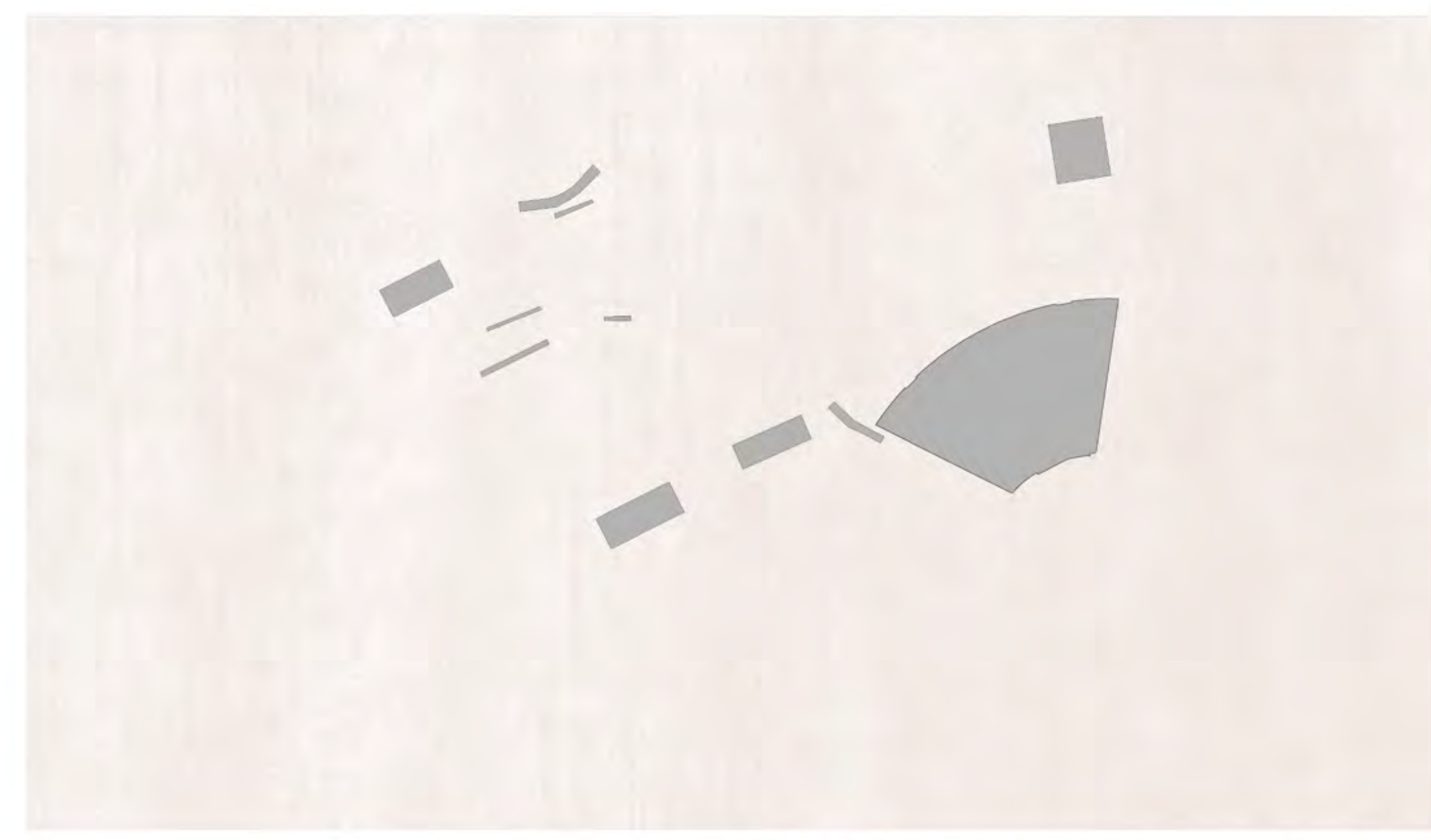
RED DE ELEMENTO SOTERRADOS PARA LOGRAR EL DIÁLOGO VEHÍCULO - PEATÓN E:1:50000

La intervención a nivel urbano desarrollada en la Avenida de las Américas tiene como objetivo principal la creación de un pulmón verde en uno de los nudos más concurridos de toda la ciudad de Málaga. Las zonas residuales entre los agitados cruces de carreteras cobran de nuevo la importancia que merecen sus árboles centenarios, para devolverles el protagonismo como elementos fundamentales del nuevo parque. Esta mancha verde en la ciudad nace como fruto de la ampliación del parque existente, unificando las zonas fragmentadas por el paso de carriles. Se estudia la reorganización óptima del tráfico en la zona para ofrecer vías alternativas a la ciudad que permitan a su vez el disfrute del parque a los ciudadanos malagueños. Con la intención de crear un camino sin interrupciones que una el nudo frente al Centro Comercial Larías con el bulvar verde en la Calle Ingeniero de la Torre Acosta, se redistribuyen los carriles destinados al tráfico rodado. Así se consigue un paseo continuo que recorra el parque y cruce el puente sobre la Avenida de Andalucía. Para ello se establece un diálogo entre las diferentes cotas del terreno y el proyecto. Pasos subterráneos, caminos elevados y adaptaciones de la topografía permiten esta unificación en un recorrido que ofrece al ciudadano un oasis dentro del caos circulatorio de la urbe.