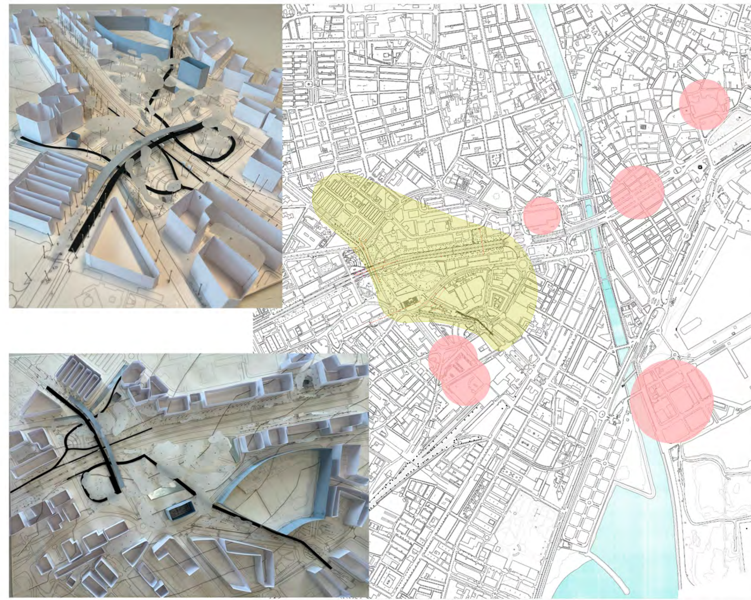
PLANTA SITUACIÓN, AMÉRICAS Y SU ENTORNO E:1:10000

La intervención a nivel urbano desarrollada en la Avenida de las Américas tiene como objetivo principal la creación de un pulmón verde en uno de los nudos más concurridos de toda la ciudad de Málaga. Las zonas residuales entre los agitados cruces de carreteras cobran de nuevo la importancia que merecen sus árboles centenarios, para devolverles el protagonismo como elementos fundamentales del nuevo parque. Esta mancha verde en la ciudad nace como fruto de la ampliación del parque existente, unificando las zonas fragmentadas por el paso de carriles. Se estudia la reorganización óptima del tráfico en la zona para ofrecer vías alternativas a la ciudad que permitan a su vez el disfrute del parque a los ciudadanos malagueños. Con la intención de crear un camino sin interrupciones que una el nudo frente al Centro Comercial Larías con el bulvar verde en la Calle Ingeniero de la Torre Acosta, se redistribuyen los carriles destinados al tráfico rodado. Así se consigue un paseo continuo que recorra el parque y cruce el puente sobre la Avenida de Andalucía. Para ello se establece un diálogo entre las diferentes cotas del terreno y el proyecto. Pasos subterráneos, caminos elevados y adaptaciones de la topografía permiten esta unificación en un recorrido que ofrece al ciudadano un oasis dentro del caos circulatorio de la urbe.