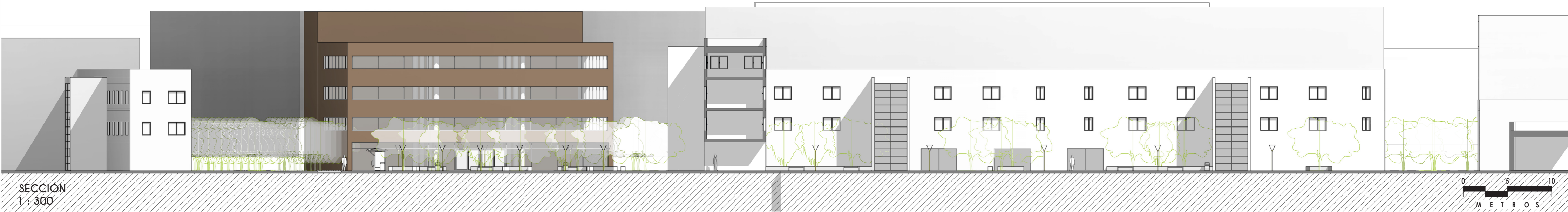
SECCIÓN 1 1 : 300