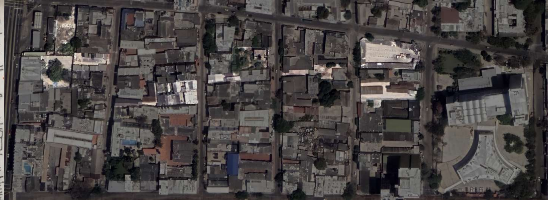
PARQUEADEROS Y ZONAS EN MAL ESTADO USADOS PARA EL PROYECTO

LA CIUDAD DE BARRANQUILLA PRESENTA UNA TRAMA URBANA DE CALLES PERPENDICULARES DOMINADAS POR EL COCHE. LA ORTOGONALIDAD DE ESTAS CALLES, SUMADO A LA DENSIDAD EDIFICATORIA DE LAS MANZANAS, CREA UN PROBLEMA DE MOVILIDAD ENTRE CALLES PARALELAS AL TENER QUE RODAR TODA UNA MANZANA PARA LLEGAR DE UNA CALLE A OTRA. EL NUEVO CAMINO QUE SE PROPONE PRETENDE DARLE UNA MEJOR FLUIDEZ DE PASO A LOS PEATONES.