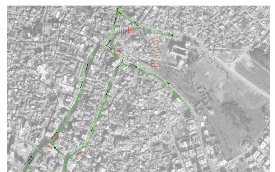
Reforma de circulación