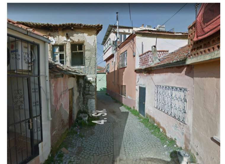
Viviendas de dos plantas o menos