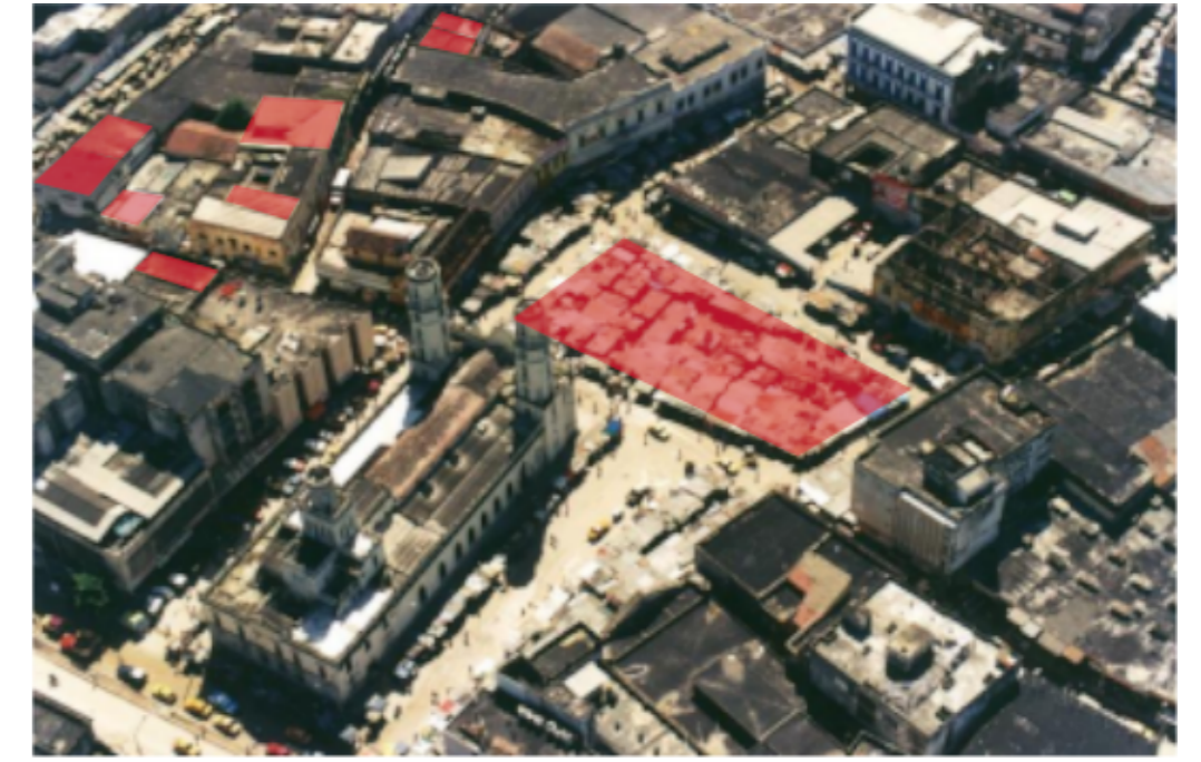
REAJUSTE DE LAS VIVIENDAS SOBREPoblación.

NUEVOS ESPACIOS PÚBLICOS FUNCIONALES, SEGUROS Y ORIENTADOS AL USO DE LAS PERSONAS, SON LUGARES QUE SATISFACEN EL BIENESTAR Y DESARROLLO PERSONAL.