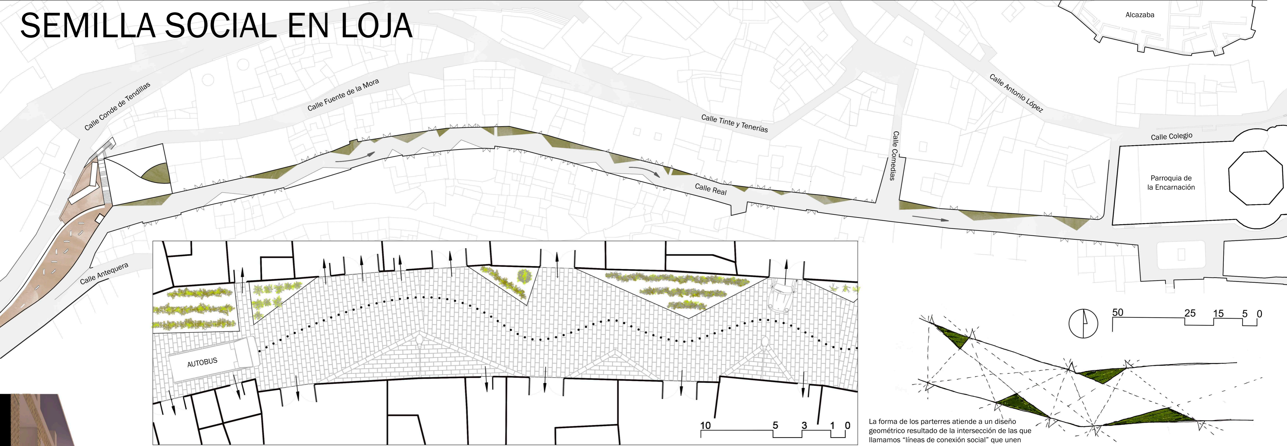
La forma de los parterres atiende a un diseño geométrico resultado de la intersección de las que llamamos "líneas de conexión social" que unen las puertas de las viviendas.