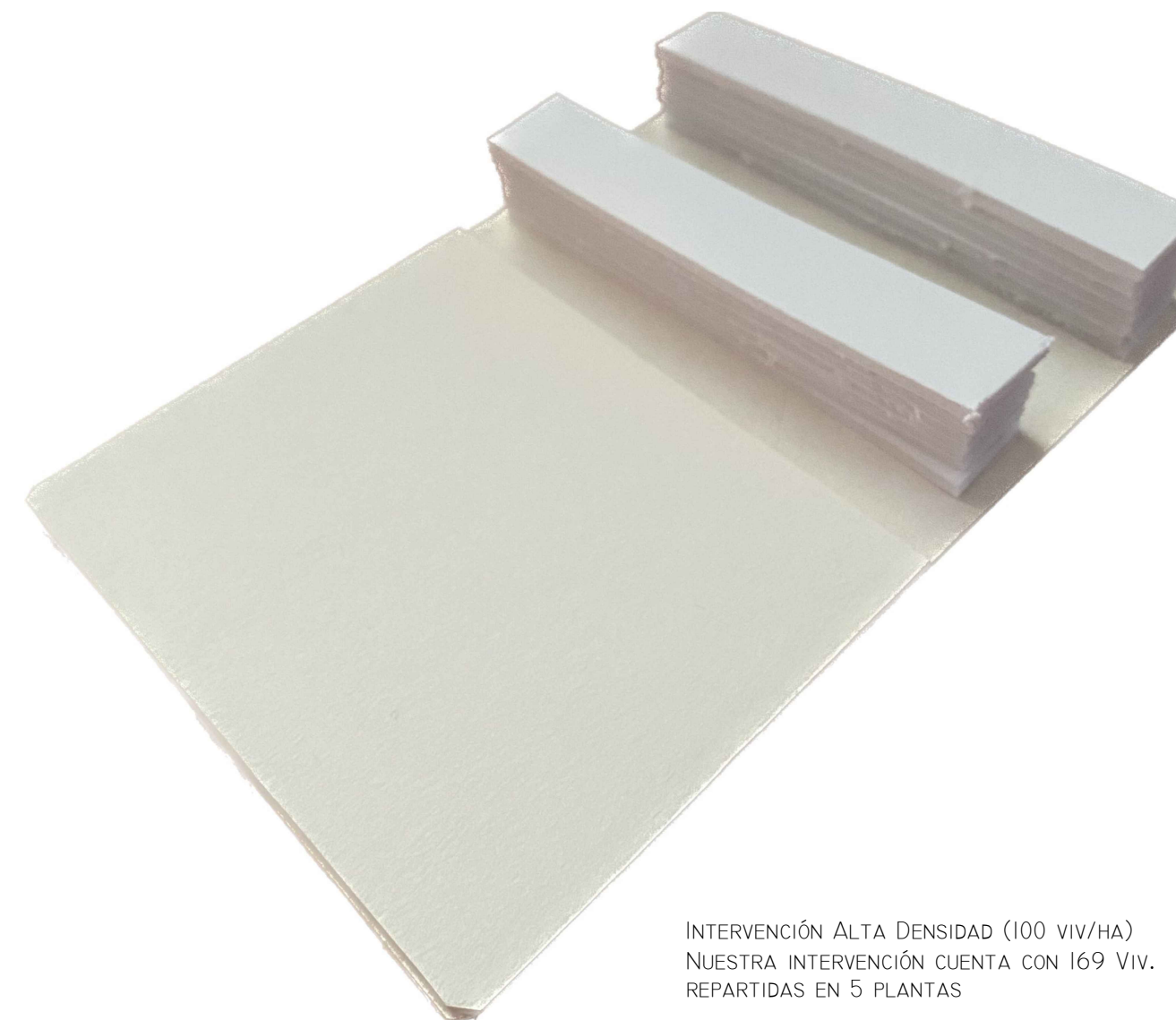
INTERVENCIÓN ALTA DENSIDAD (100 viv/HA) NUESTRA INTERVENCIÓN CUENTA CON 169 VIV. REPARTIDAS EN 5 PLANTAS