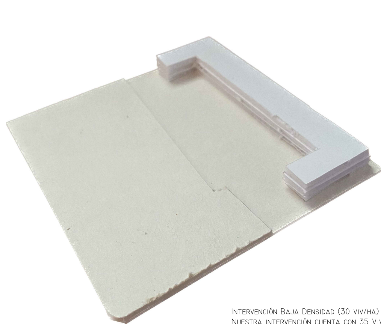
INTERVENCIÓN BAJA DENSIDAD (30 viv/HA) NUESTRA INTERVENCIÓN CUENTA CON 35 VIV. REPARTIDAS EN 2 PLANTAS

EN ESTE EJERCICIO HEMOS SELECCIONADO TRES MANZANAS CONTIGUAS ENTRE UNA DE LAS ZONAS MÁS LONGEVAS DE LA CIUDAD, EL BARRIO MÁS DESARROLLADO ECONÓMICAMENTE Y LA PARTE QUE MENOS LO ESTÁ. EN LAS TRES TIPOLOGÍAS DIFERENTES SE HA EXTRAÍDO LA MITAD DE LA PARCELA Y SE HA IMPLEMENTADO UNA DISPOSICIÓN DE BLOQUES DE VIVIENDAS RESPETANDO LA MANZANA Y EL TRÁFICO. EN LAS TRES PROPUETAS SE BUSCA MEJORAR LA VIDA DE LOS HABITANTES DE MENDOZA CREANDO COMUNIDADES DE VECINOS CON ESPACIO SEMI-PÚBLICO DONDE PUEDES DESARROLLAR CON NORMALIDAD SUS ACTIVIDADES DEL DÍA A DÍA.