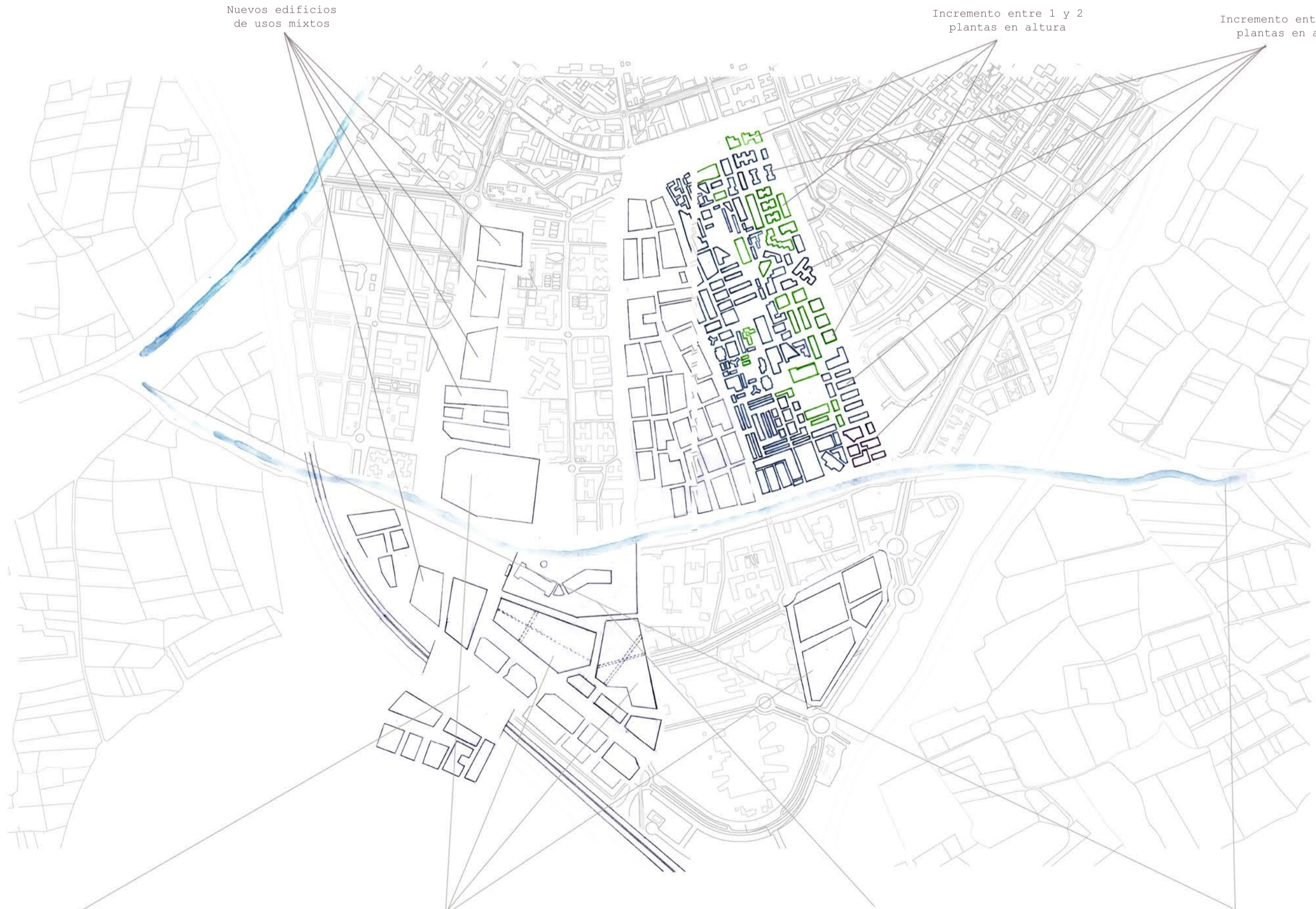
1 Unión con Armilla como nuevo barrio de Granada

Incremento entre 3 y 4 plantas en altura