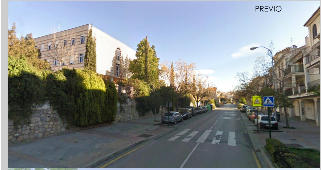
Calle principal del I.E.S Miguel de Cervantes. Montaje 1