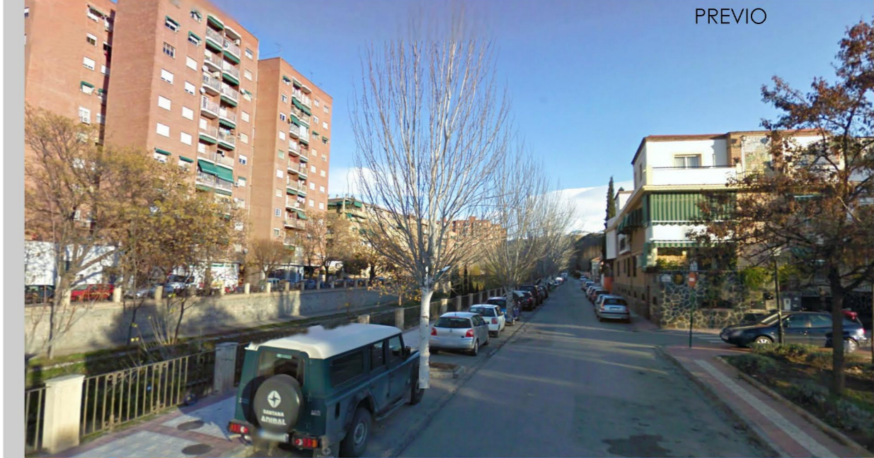
Paseo Fuente de la Bicha. Montaje 2