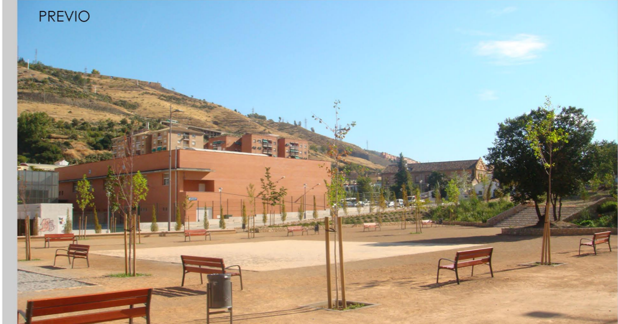
Plaza complejo deportivo. Montaje 3