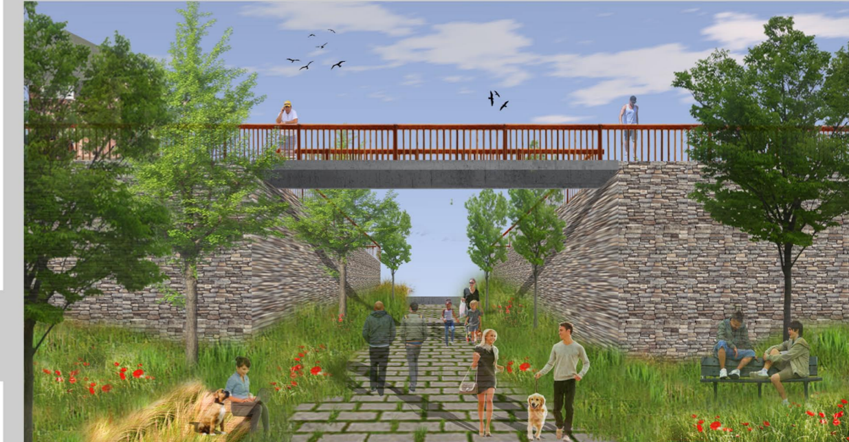
Pasaje IES. Montaje 4

La idea se basa en crear una continuidad verde, introducir la naturaleza en la ciudad, reforzar las relaciones entre los centros educativos y sacar un aprovechamiento mayor de un foco con gran energía, como es esta zona. La intervención abarca diferentes aspectos: