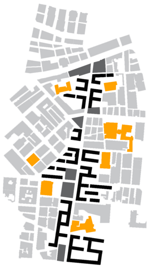
ESQUEMA DE PROYECTO

Actualmente, el eje que conecta la estación con la costa marítima está interrumpido por un edificio que detiene la continuidad, además, los hitos presentes en el área están aislados y no están bien conectados con el eje principal.