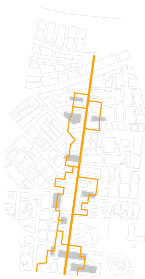
ESQUEMA RECORRIDOS Y ESPACIOS PUBLICOS

El desarrollo en ortogonal se diseñó para dar permeabilidad al nuevo distrito, creando sin embargo continuidad de los frentes urbanos para dar más intensidad al eje de conexión que se abre en las intersecciones con los ejes principales preexistentes.