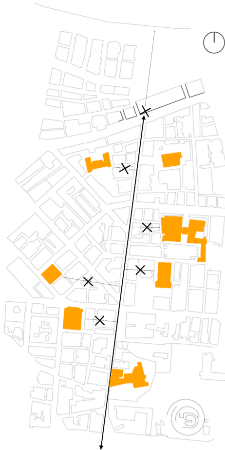
ESQUEMA ESTADO DE FACTO