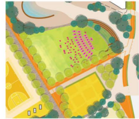
FITNESS CLASS PROGRAM

Grading creates a bowl-like condition which enhances instructor visibility during fitness classes.