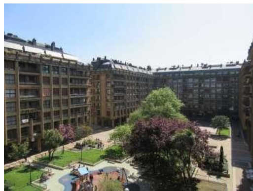
Plaza del Txofre