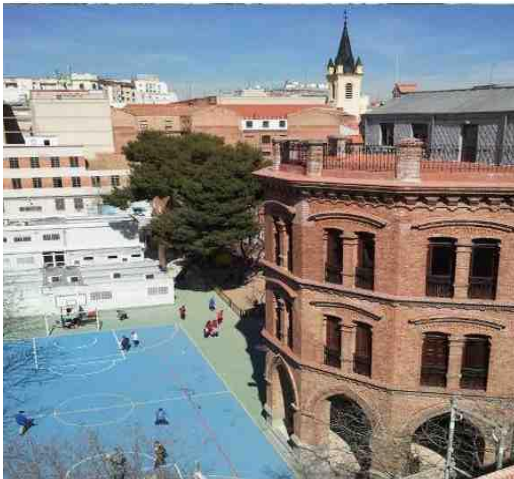
Colegio El Porvenir.