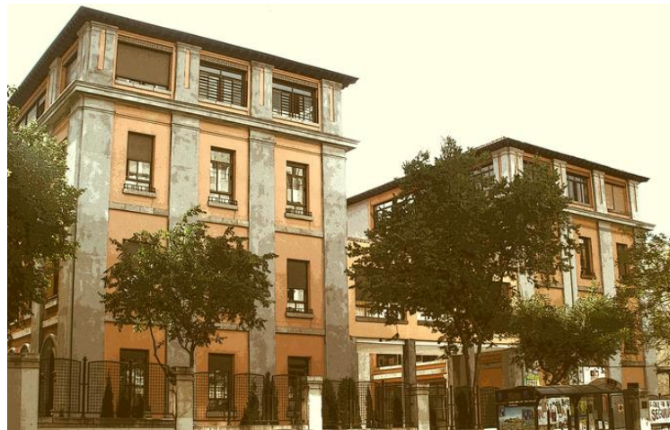
Colegio Rufino Blanco.