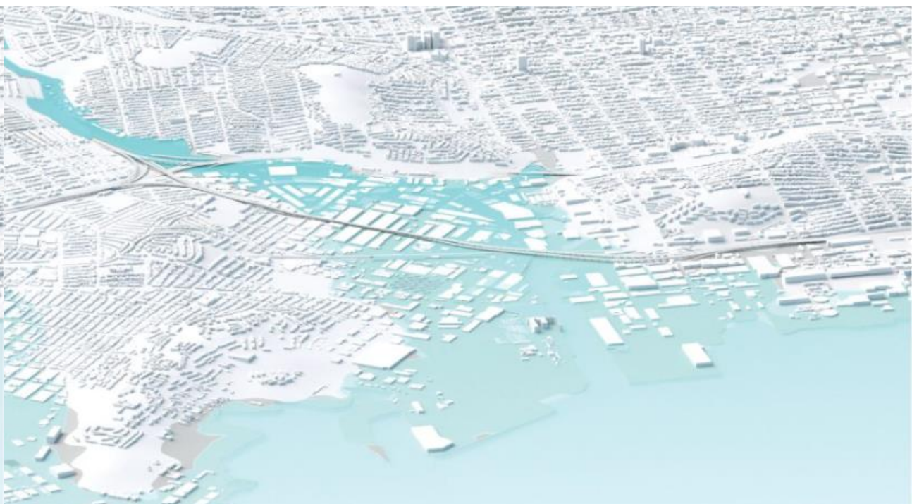
Futuros retos medioambientales