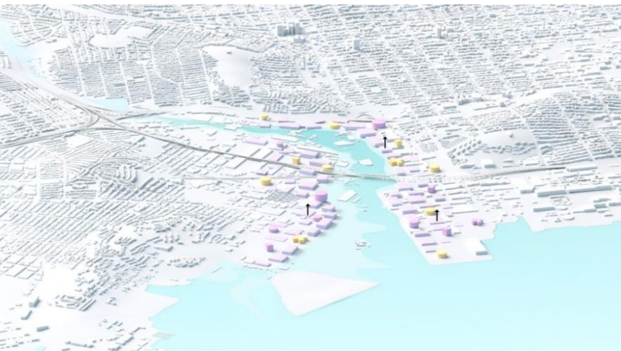
3. Edificio a pleno rendimiento