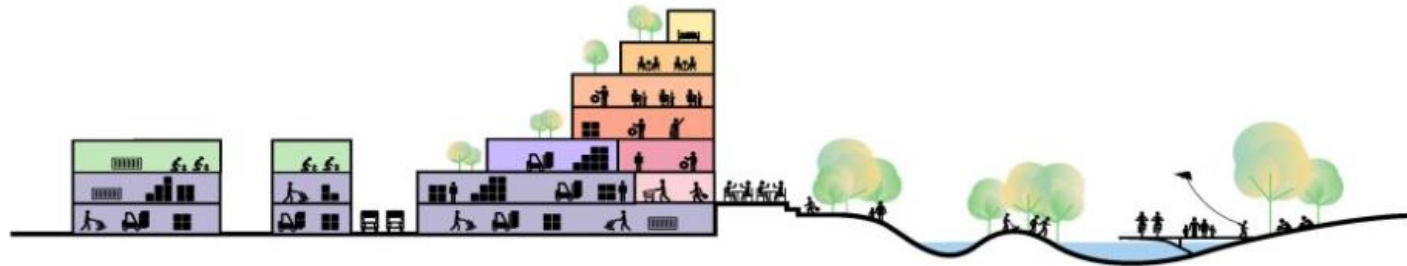
SUSTAINABLE WATER MANAGEMENT AND PROGRAM AT MAXIMUM CAPACITY