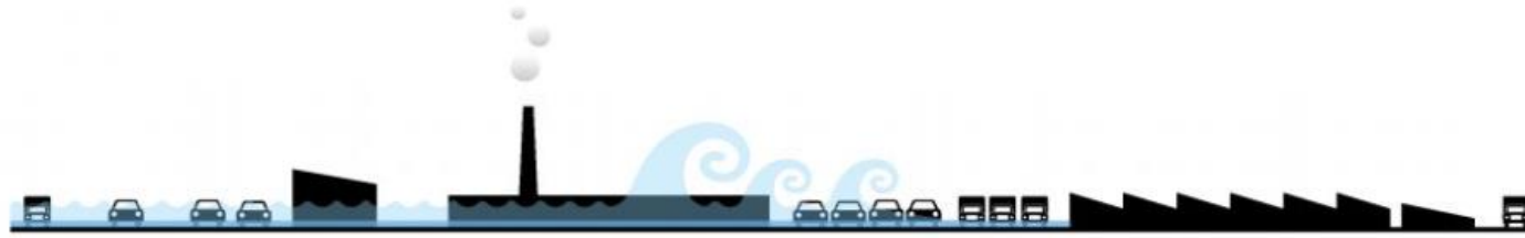
CURRENT SITUATION AND CLIMATE STRESSES