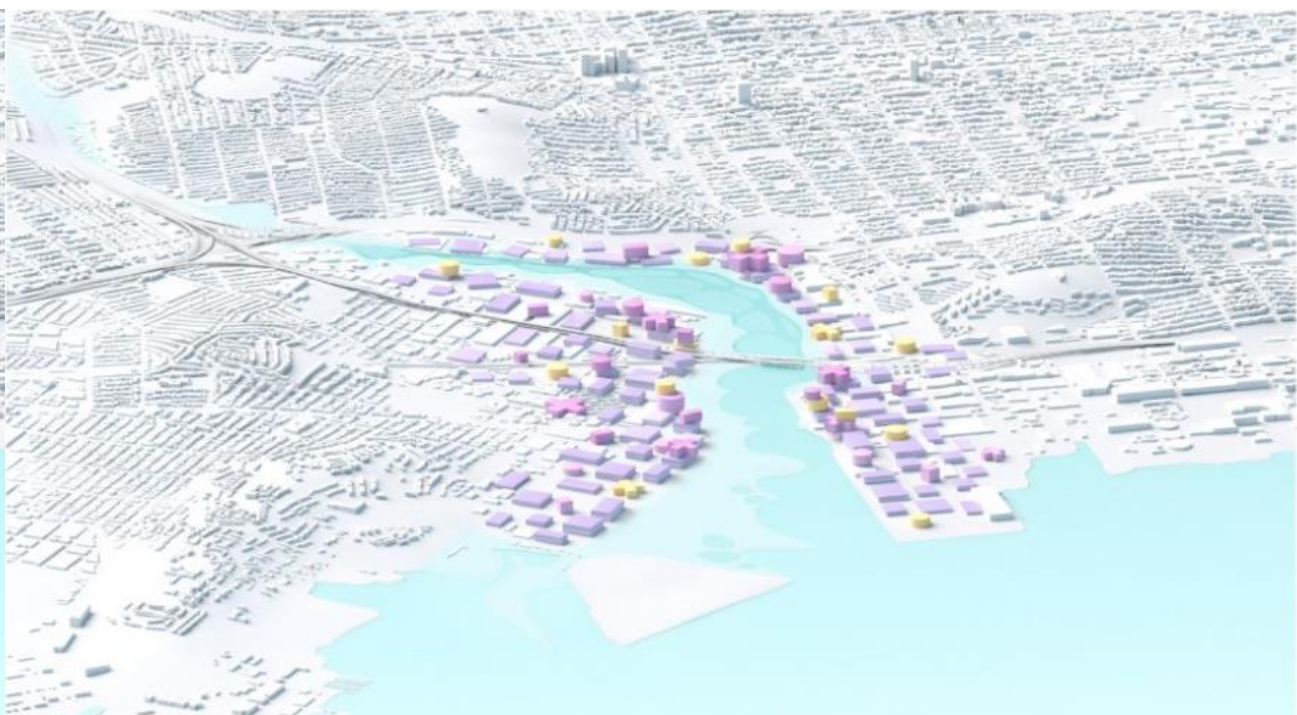
4. Hipernatural e hiperurbano