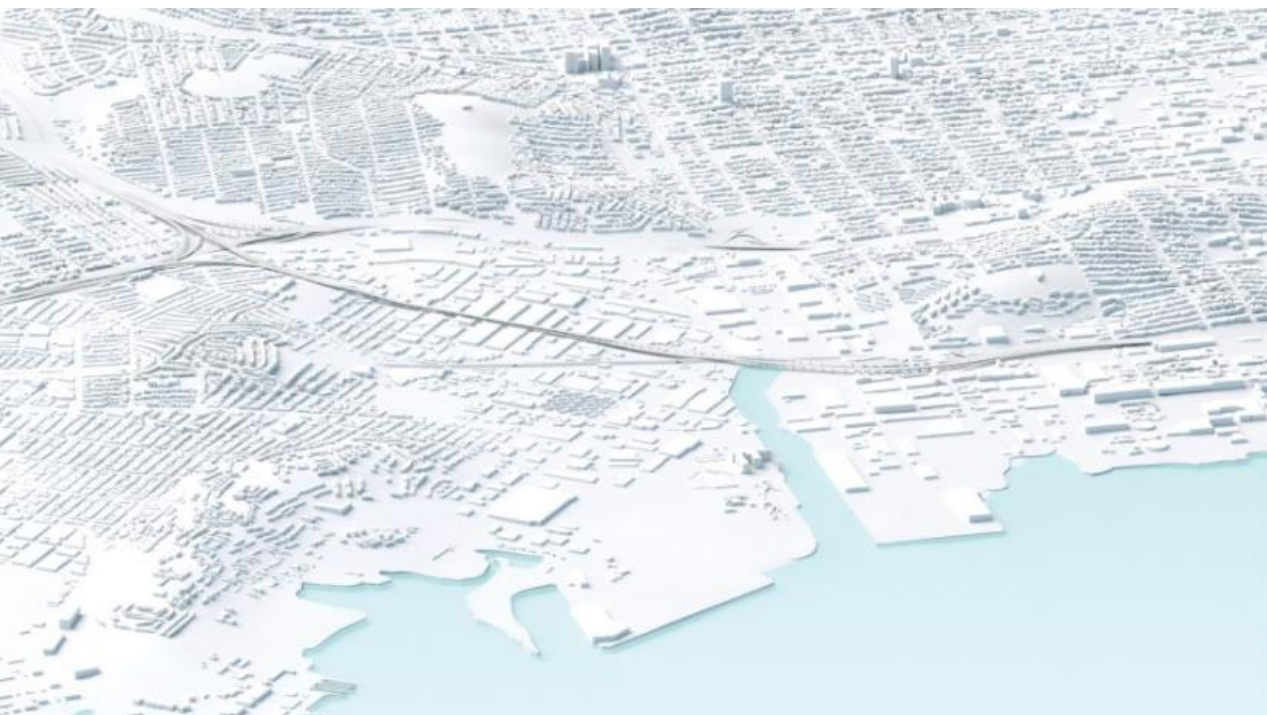
El crecimiento de la ciudad de hoy