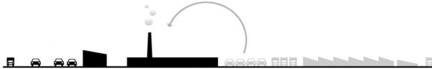
LAND PURCHASE AND ASSEMBLY