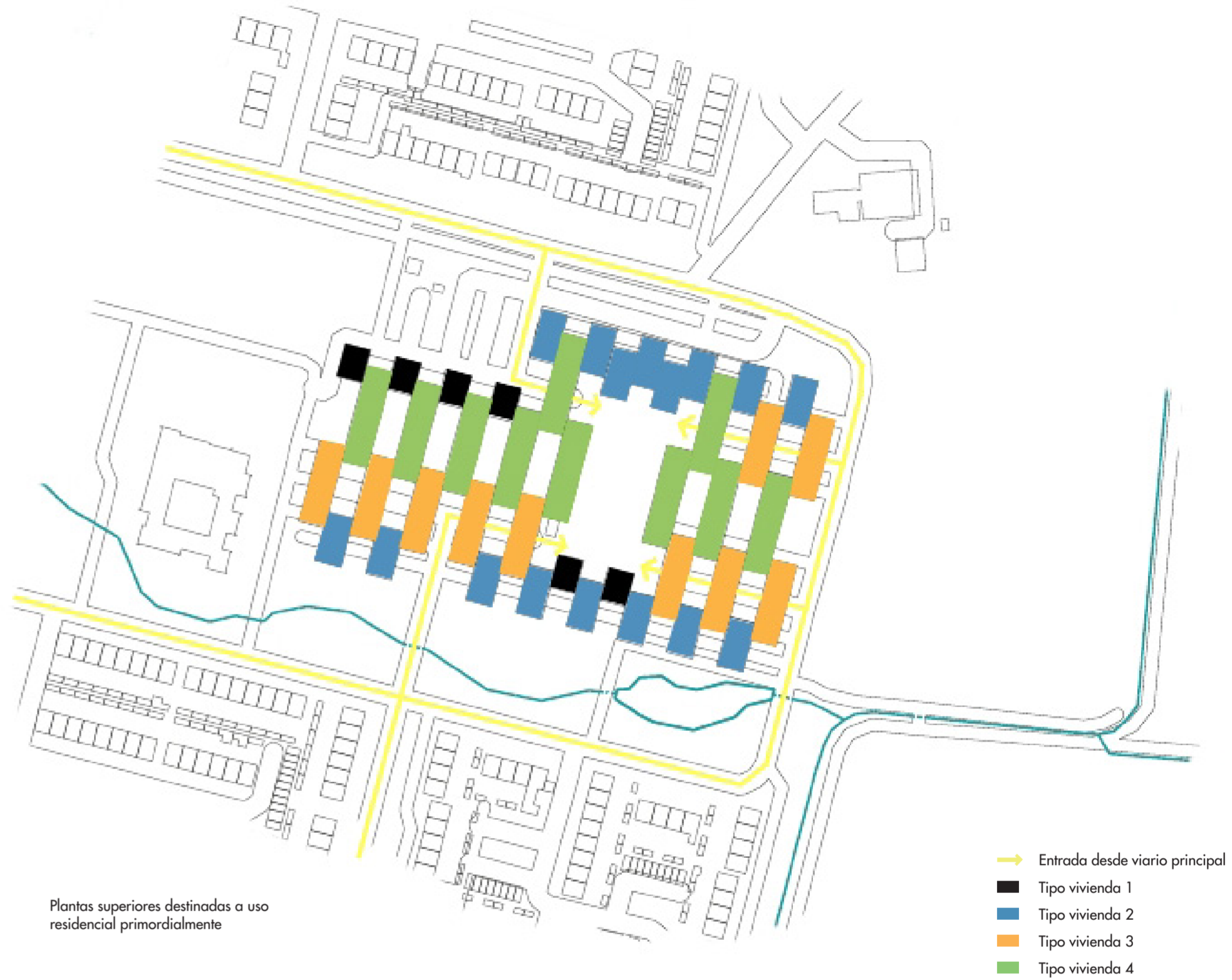
Plantas superiores destinadas a uso residencial primordialmente