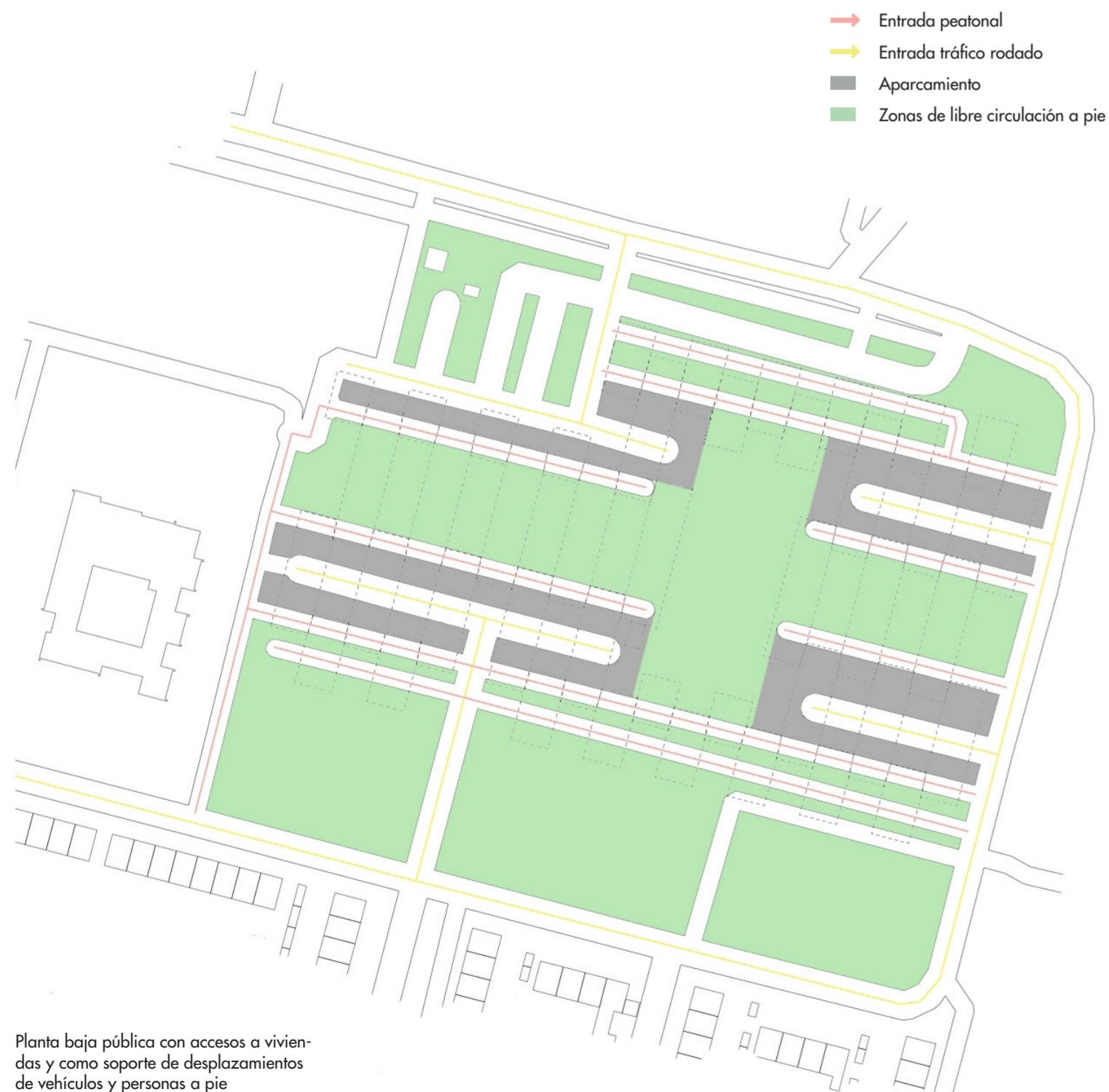
Planta baja pública con accesos a viviendas y como soporte de desplazamientos de vehículos y personas a pie