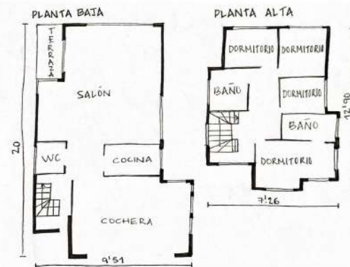
PLANTAS VIVIENDA UNIFAMILIAR

Añadimos viviendas unifamiliares (color azul), en una parcela se prolongan las ya existentes y en la otra se sitúan hacia la carrera 45.