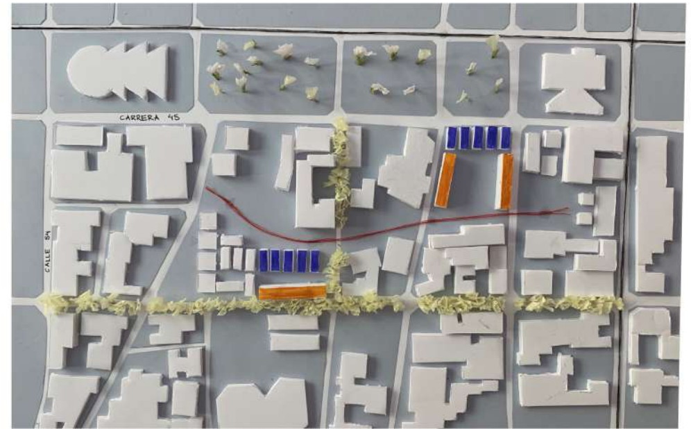
MAQUETA DE LA ZONA DE INTERÉS ESCALA 1/2000

Señalamos las nuevas avenidas peatonales, situadas en la Carrera 44, y una trasversal en la calle 50. Se crea un bulevar entre las cuatro parcelas (hilo rojo), generando mejor comunicación y un espacio común, tranquilo que mejora la ventilación de las viviendas y edificios de alrededor.